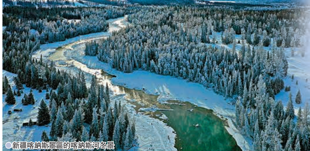
●新疆喀納斯景區的喀納斯河冬景