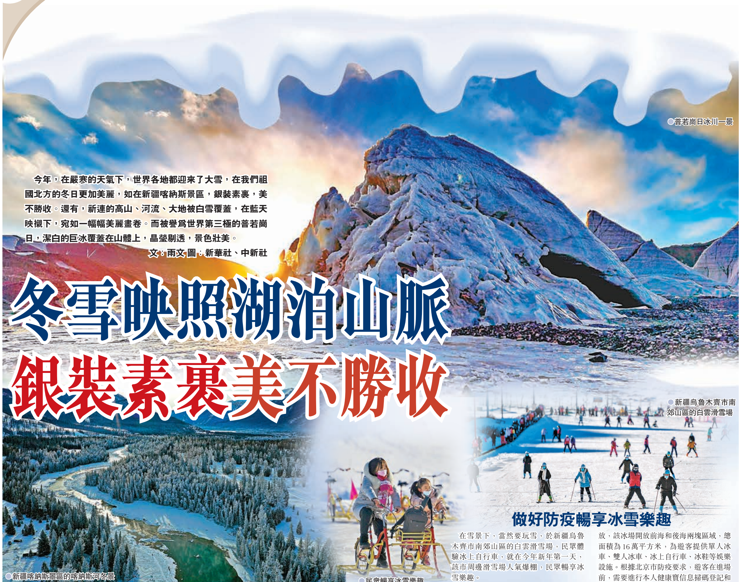
●普若崗日冰川一景

今年，在嚴寒的天氣下，世界各地都迎來了大雪，在我們祖國北方的冬日更加美麗，如在新疆喀納斯景區，銀裝素裹，美不勝收。還有，祈連的高山、河流、大地被白雪覆蓋，在藍天映襯下，宛如一幅幅美麗畫卷。而被譽為世界第三極的普若崗日，潔白的巨冰覆蓋在山體上，晶瑩剔透，景色壯美。