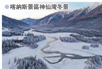
●喀納斯景區神仙灣冬景

放，該冰場開放前海和後海兩塊區域，總面積為16萬平方米，為遊客提供單人冰車、雙人冰車、冰上自行車、冰鞋等娛樂設施。根據北京市防疫要求，遊客在進場前，需要進行本人健康寶信息掃碼登記和測量體溫，並且要全程佩戴好口罩。