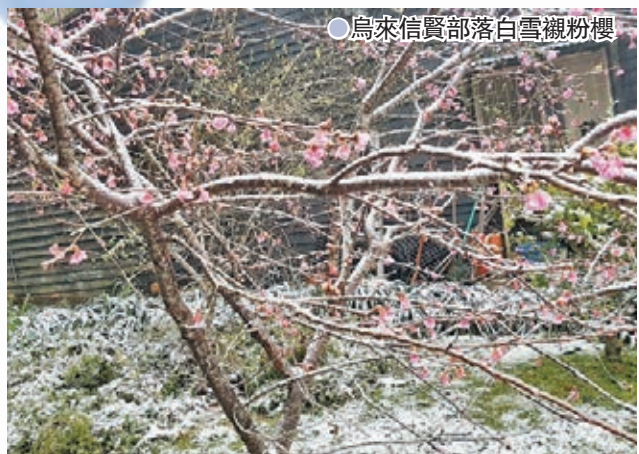
●烏來信賢部落白雪襯粉櫻