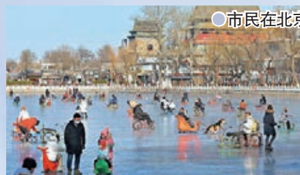
●市民在北京什刹海冰場體驗冰上樂趣

普若崗日冰原面積422平方公里，冰原表面平坦，呈西北東南方向條形分布。冰原向四周山谷放射溢出50多條長短不等的冰舌，最低處海拔5350米。經鑽探和雷達測量，冰溫為-10℃；在冰層底部，冰溫為-5℃至-3℃。冰源海拔6400米處，2000年到2001年極端最低氣溫達到-60℃。