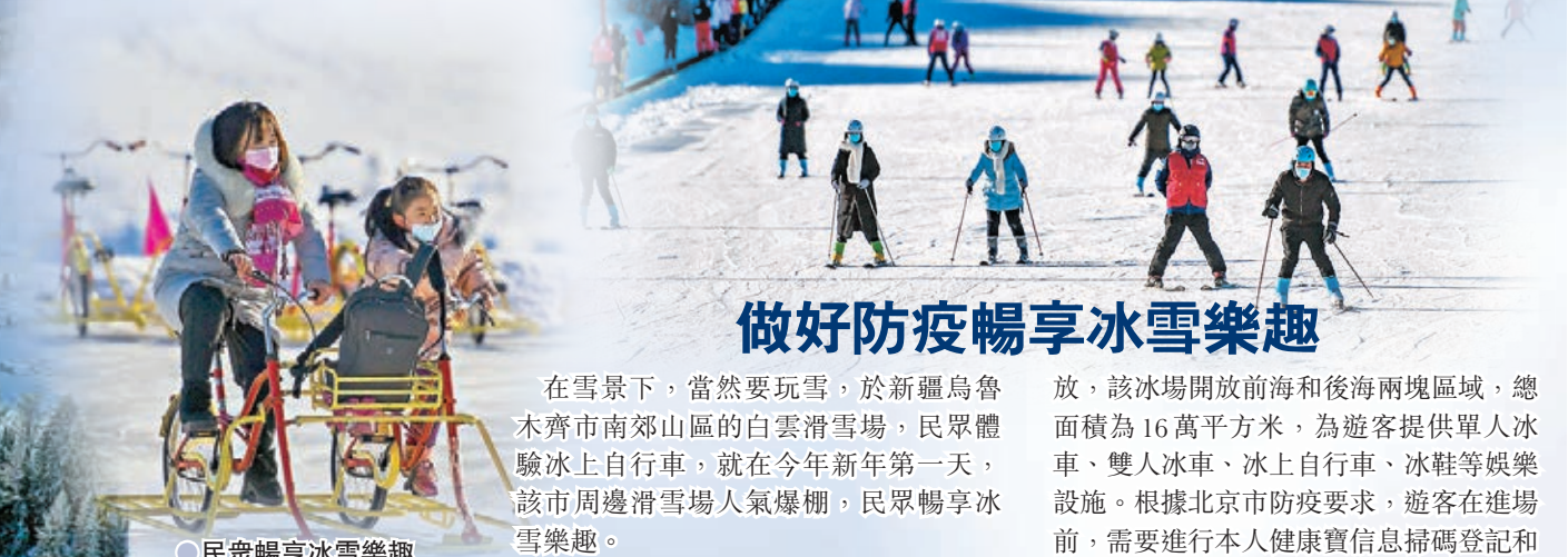
●新疆烏魯木齊市南郊山區的白雲滑雪場