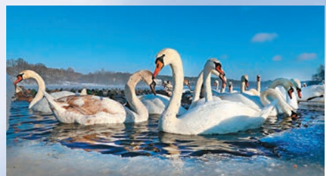
●在白俄羅斯首都明斯克拍攝的天鵝