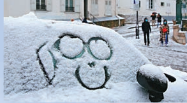
●在法國巴黎蒙馬特高地拍攝的積雪車窗上的笑臉