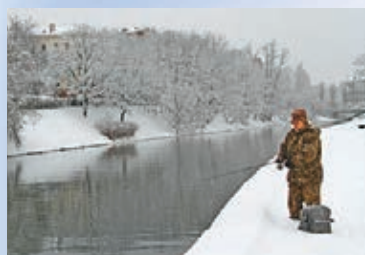
●在白俄羅斯首都明斯克，一名老人站在雪地裏垂釣。

而在白俄羅斯，則有越冬天鵝，雖然此時白俄羅斯已是寒冬，但首都明斯克的一處不凍湖仍吸引一些天鵝到此越冬。