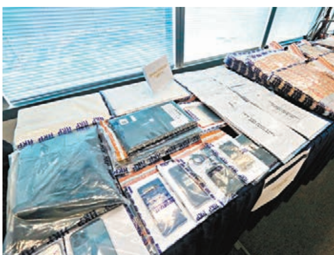
●警方在記者會展示檢獲證物，包括大量涉案文件、手提電話及780萬元現金。

前日(19日)清晨，商業罪案調查科展開代號「凌霄」拘捕行動，在全港各區拘捕該7名現任或前銀行職員，並搜查他們住所及工作地點；另人員再根據資料，搜查14個