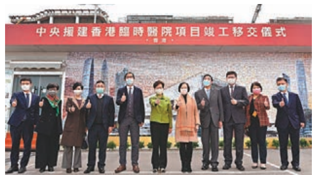
▲林鄭月娥(右六)表示，項目再次傳達了中央對香港特區政府抗疫工作的支持和對香港市民的關愛。圖為特首與其他嘉賓合照。