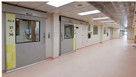
▲醫院內的真氣壓病房。