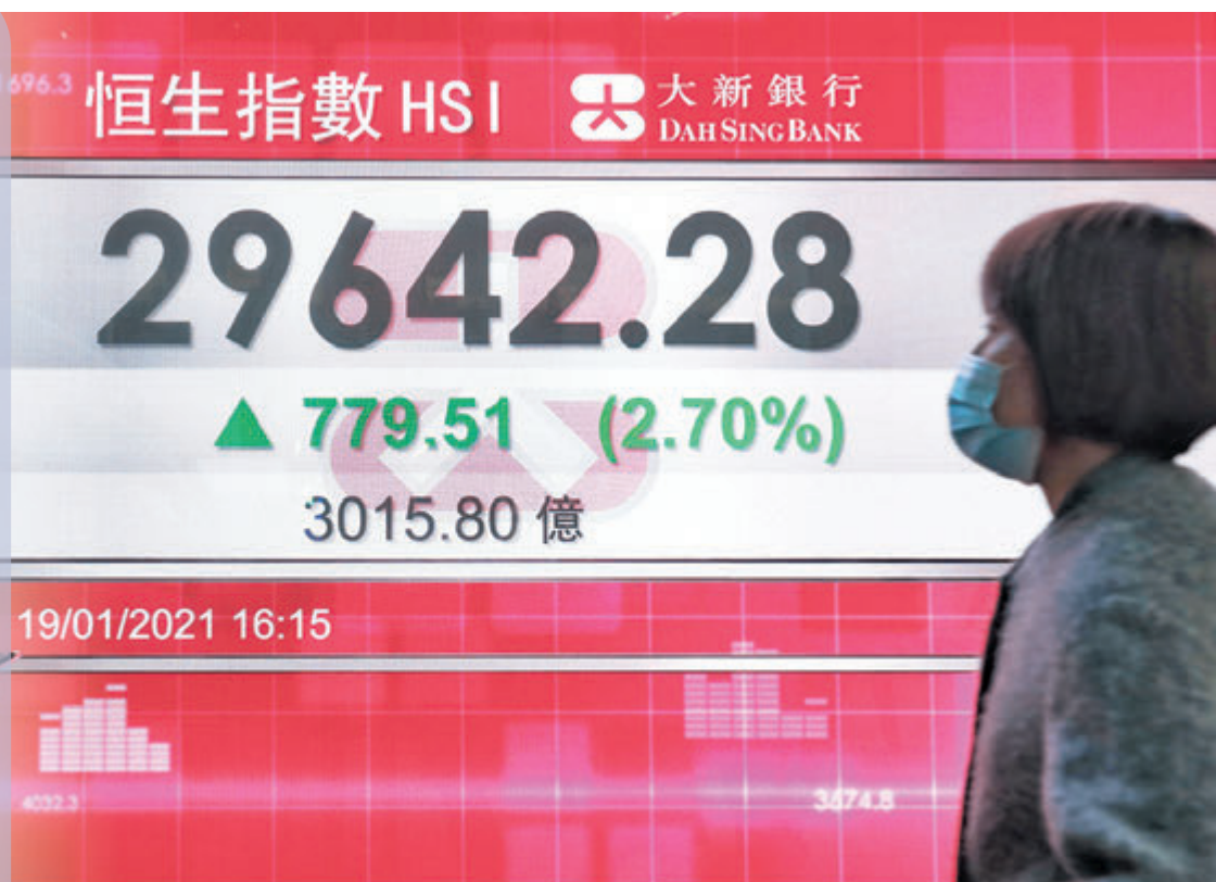
▲港股昨一度狂飆986點，直撲三萬關。