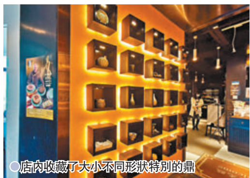
店內收藏了大小不同形狀特別的鼎