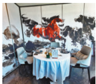
房間以書畫藝術作裝飾