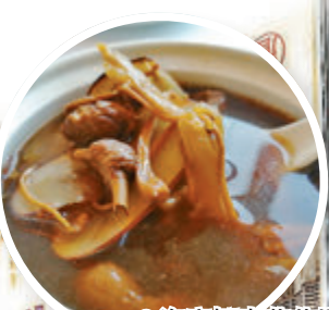
海底椰蟲草花燉乳鴿