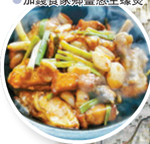
加錢食家鄉薑蔥生蠔煲