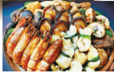
新春節慶限定「傳統手工盆菜」