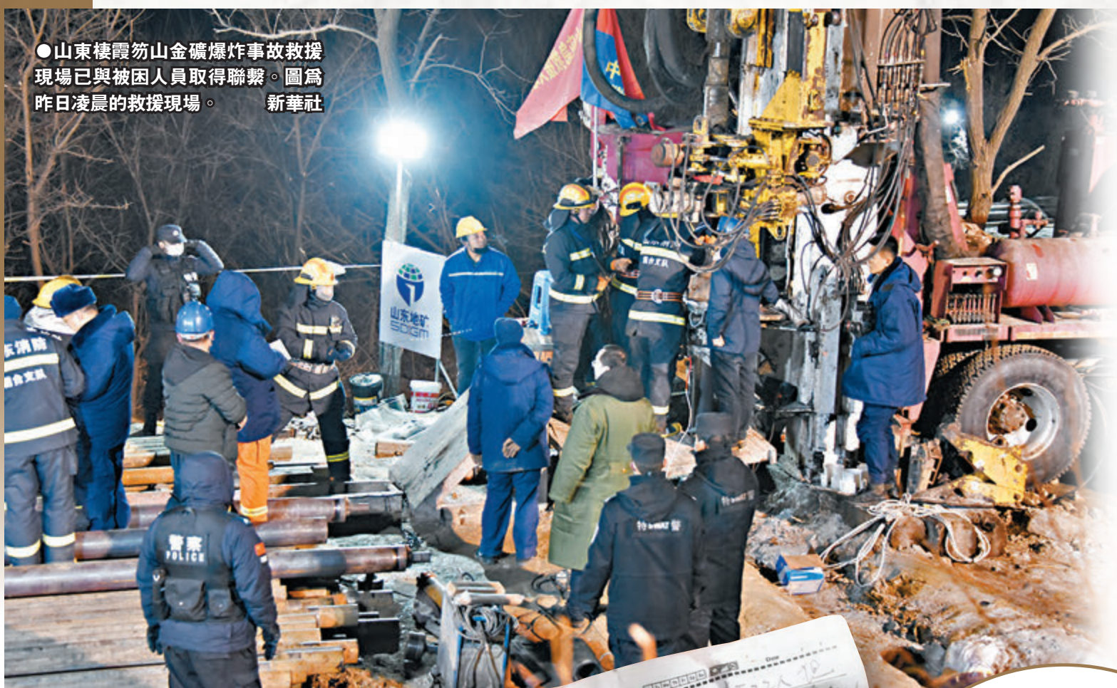
●山東棗礦山金礦爆炸事故救援現場已與被困人員取得聯繫。圖為昨日凌晨的救援現場。新華社