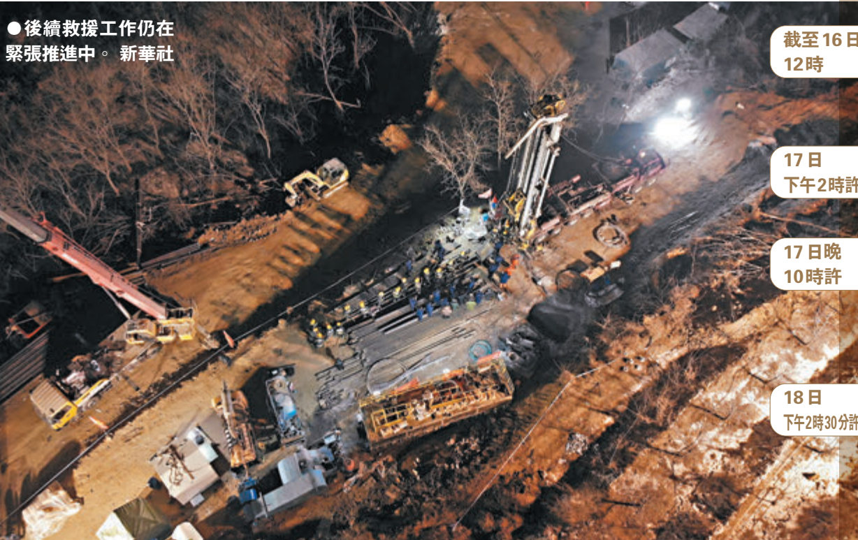
●後續救援工作仍在緊張推進中。新華社