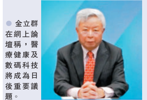
● 金立群在網上論壇稱，醫療健康及數碼科技將成為日後重要議題。