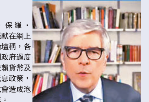
● 保羅·羅默在網上論壇稱，各國政府過度依賴貨幣及低息政策，或會造成泡沫。