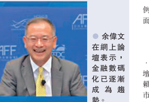
● 余偉文在網上論壇表示，金融數碼化已逐漸成為趨勢。

香港文匯報訊（記者 殷考玲）疫情加速醫療健康的發展，亞洲基礎設施投資銀行行長金立群昨日出席亞洲金融網上論壇時表示，受惠於各國及公私營機構的緊密合作，新冠肺炎疫苗推出的時間較預期