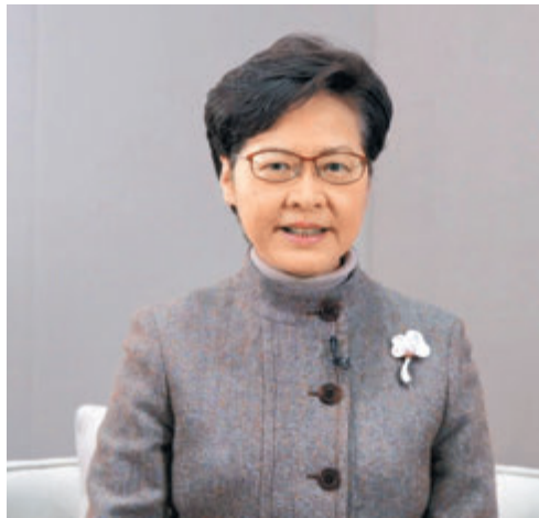
● 林鄭月娥昨於線上亞洲金融論壇致辭時表示，過去一年儘管新冠疫情衝擊之下困難重重，香港的金融體系展現了其實力和韌性。

香港文匯報訊（記者 周曉菁）行政長官林鄭月娥昨於線上亞洲金融論壇致辭時表示，2020年是「希望被忘卻但難以忘懷的一年」，疫情令去年全球經濟增長下降4.4%，預計香港全年也將收縮6.1%。她展望2021年將是「機遇與挑戰並存的一年」，隨著新冠肺炎疫苗陸續在多個國家和地區啟用，如果疫苗成效顯著，相信2021年下半年經濟有望復甦。