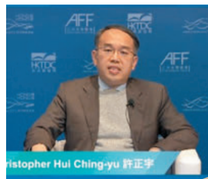
● 許正宇認為，香港金融業足夠進一步支持實體經濟的復甦。

也表示，香港金融市場在疫情下仍然有大幅度增長，表明金融業足夠進一步支持實體經濟的復甦，政府可推出更多政策吸引私募基金來港、規管虛擬資產等。他強調，疫情讓世界更加意識到科技的重要性，政府會繼續努力發展科技和創新，令香港能夠升級為國際金融科技中心。