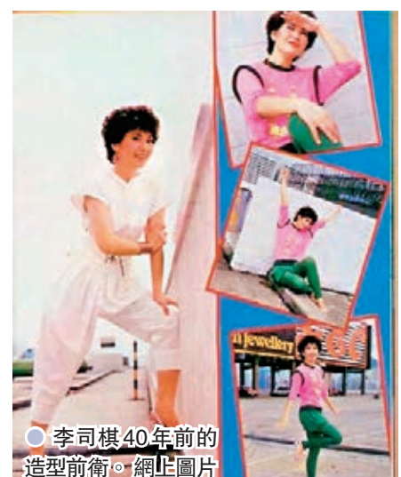
李司棋40年前的造型前衛。