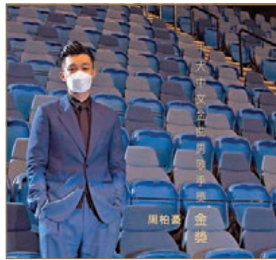
周柏豪覺得音樂是藥。

香港文匯報訊(記者 阿祖、達里)《第43屆十大中文金曲·音樂說》頒獎典禮昨晚舉行,由於疫情關係,頒獎禮以特備節目形式於港台電視頻道及網上播放並公布結果,當中最具分量大獎「全球華人至尊金曲獎」再由莫文蔚奪得。闊別香港樂壇十年的她,憑主唱劇集《飛虎之雷霆極戰》主題曲《呼吸有害》,之前已在新城勁爆頒獎典禮及叱咤樂壇頒獎典禮上,先後奪得最高榮譽的「勁爆年度歌手」及「叱咤至尊歌曲大獎」,昨晚她再下一城捧走十大中文金曲的「全球華人至尊金曲獎」,已經成為三連冠,再看今晚舉行的十大勁歌金曲頒獎禮,莫文蔚能否橫掃四台最高榮譽大獎,成為大滿貫的大贏家。