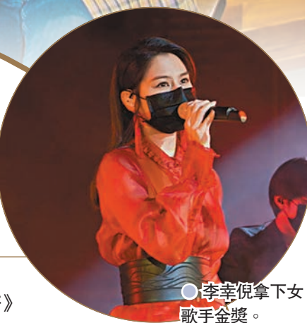
李幸倪拿下女歌手金獎。

男歌手:許廷鏗《拾》 女歌手:鄧紫棋《摩天動物園》 樂隊/組合:小塵埃《Little By Little》