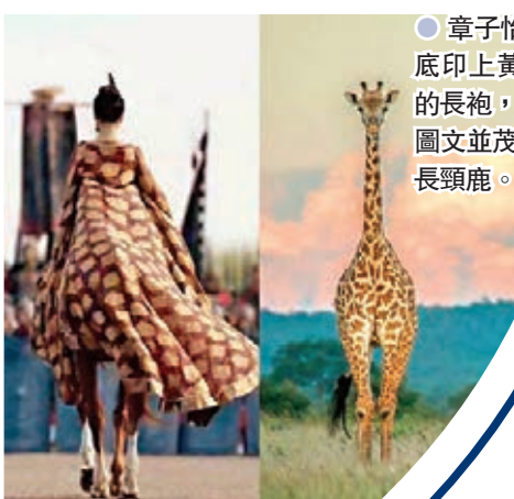
章子怡穿的啡色底印上黃色圖案的長袍,被網民圖文並茂嘲笑似長頸鹿。