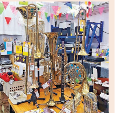
●在本港創立超過一個世紀的曾福琴行，在官方網站宣布「光榮結業」，而琴行正式結業前大清貨，各款樂器及書籍等所有貨品，均標示以「出血價」銷售。

香港文匯報訊(記者 文森)新冠疫情令各行業備受打擊，在本港創立超過一個世紀的曾福琴行，在官方網站宣布「光榮結業」，而琴行正式結業前大清貨，各款樂器及書籍等所有貨品，均標示以「出血價」銷售。不少市民則對曾福琴行結束業務感到可惜。 曾福琴行宣布將營業至3月，並在facebook宣布清貨，不少貨品以極便宜價格出售，其中有韓國品牌的鋼琴只售5,000元，一套架子鼓亦只要4,000多元，而上萬本樂理書籍更每本只賣10元。琴行未解釋結業的原因，只感謝顧客一直以來的支持。不少網民對曾福琴