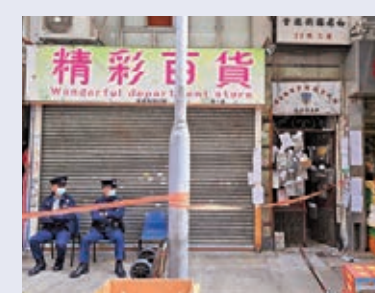
●新填地街20號至26號雙號唐樓現場以橙帶封鎖，並有警察駐守。