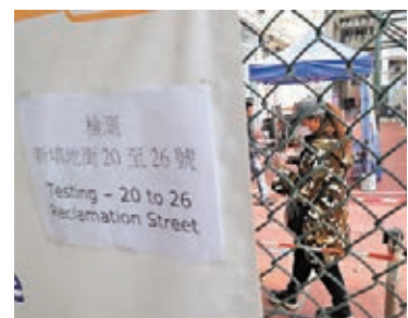
●梁顯利油麻地社區檢測中心

人輪候，其後人流減少；亦有部分居民到流動採樣車檢測，亦未見人龍。 吳松街居民高先生昨日下午到官涌體育館檢測。他直言「唔使排隊，好快好方便」，又認為僅收緊強檢門檻並不足夠，建議加強後續配套措施，如禁足令等以多管齊下控制疫情，「呢個(檢測)只係一時結果，話唔定一個鐘頭、10分鐘之後就被感染，要有配套先可以。」 居於「疫區」的溫女士說，自己所住大廈有人確診，住戶也擔憂，在地盤工作的兒子下班後亦會接受檢測，「好擔心(區內)咁多人確診，(新規定)幾好，早啲測完早啲安心。」 居於該區的楊先生直言，不少居民缺乏防疫意識，不戴口罩出