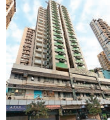
●廣基大廈

議效仿內地，在社區爆發後即發出禁足令。他說：「如果有禁足令，居民仍可返工，去食肆、商場，病毒一樣可以散出去」，但他明白市民或有很大抗拒，「所以我覺得小區盡量放資源，如果配合到禁足令又提供到物資界拒(居民)，真係要停嚟裏面，唔好周圍走，檢測效果就好好多。」