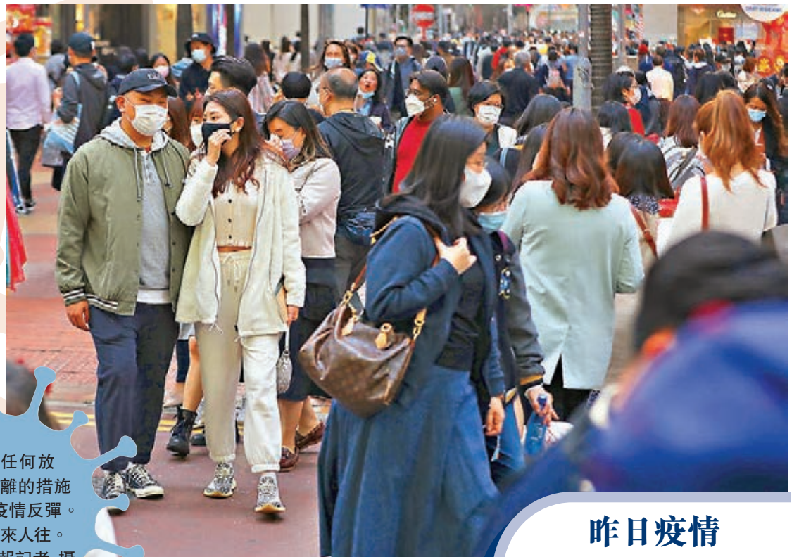
●目前任何放寬社交距離的措施都可能令疫情反彈。圖為街上人來人往。香港文匯報記者 攝

衛生防護中心早前在仁石樓取得28個環境樣本，採集位置包括兩個確診單位內的排氣喉、抽氣扇及天井的喉管面等，檢測結果均呈陰性。她解釋，即使找不到病毒，亦不代表垂直傳播的假設不成立，「(環境樣本)找不到陽性，不等於當時的假設不成立，如找到陽性便可在那位置找到多一點線索。」她相信是居民事後加強清洗有關設施，使政府抽取的樣本全部呈陰性。