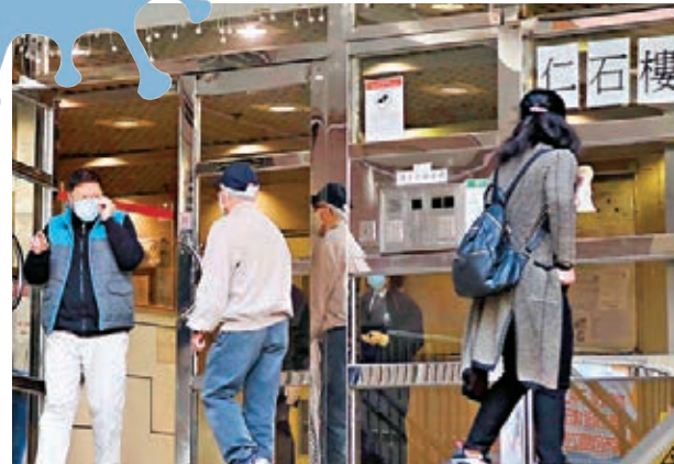
●葵涌石蔭邨仁石樓昨日再有一名09室住戶及一名高層08室住戶確診。圖為仁石樓。