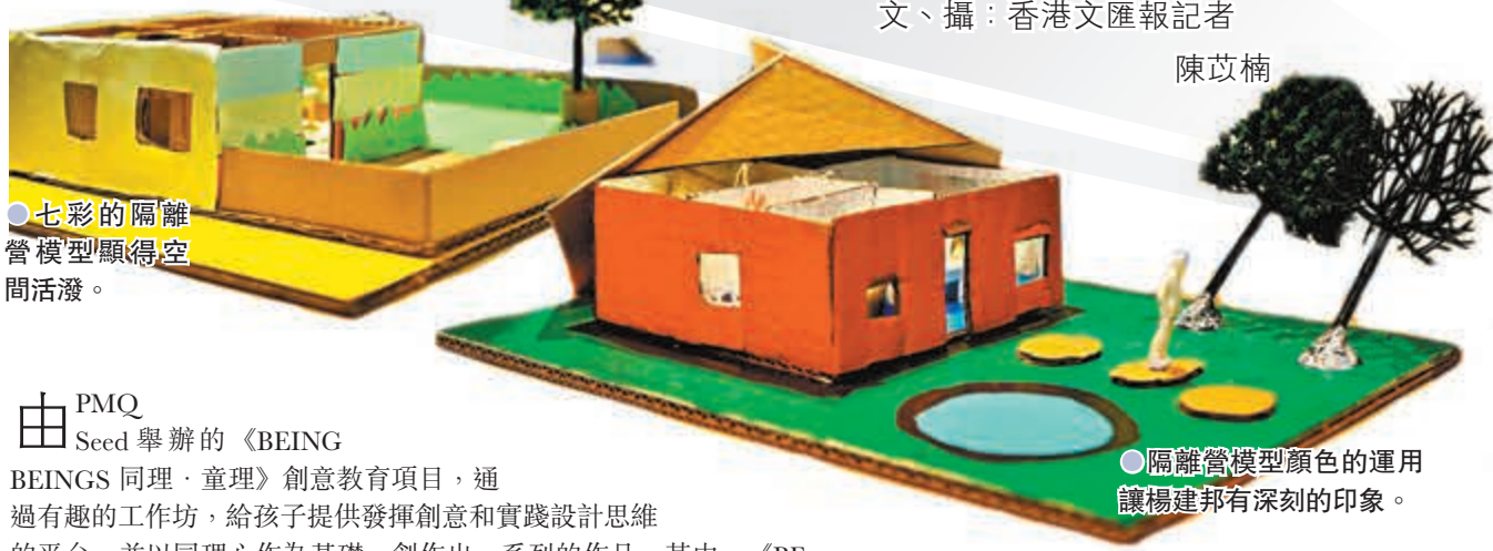
●七彩的隔離營模型顯得空間活潑。