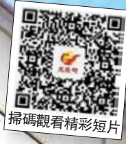
●掃描觀看精彩短片

《BEING BEINGS 同理·童理校園計劃》學生作品展 活動日期：即日起至2021年1月17日 開放時間：11am - 7pm 地點：PMQ元創方A座3樓 S309、310、313及314室