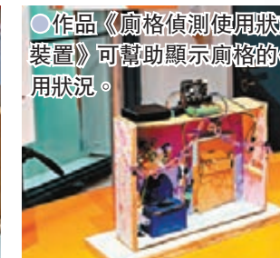
●作品《廁格偵測使用狀態裝置》可幫助顯示廁格的使用狀況。