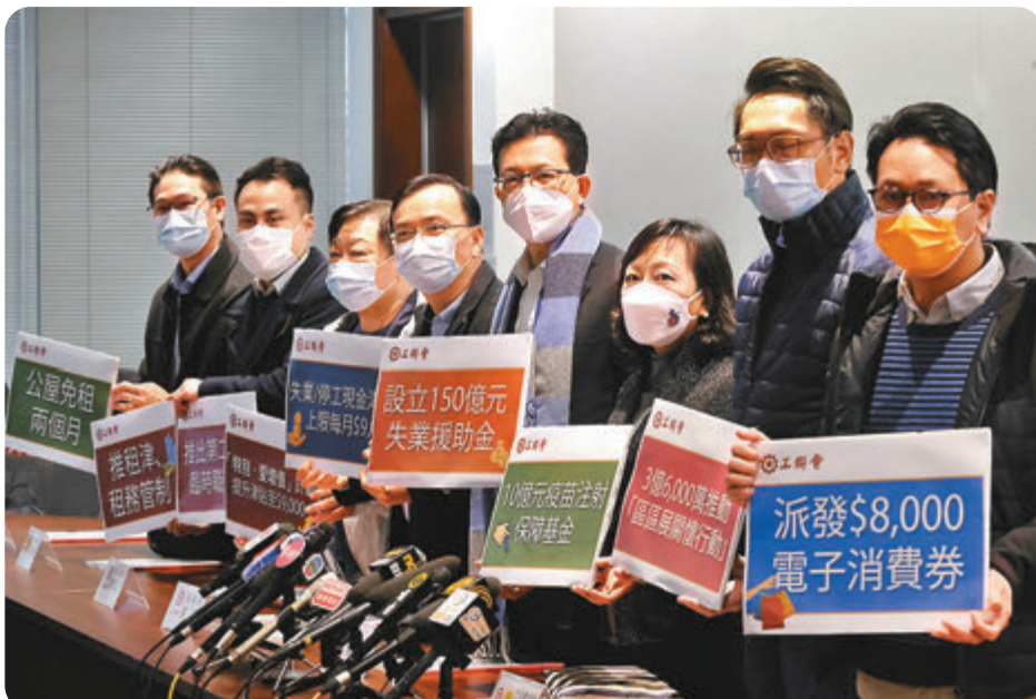
●工聯會促請政府成立150億元臨時失業援助金。