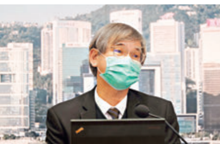
●羅致光表示，兩元乘車優惠料最快明年首季擴至60歲或以上長者。

香港文匯報訊（記者 成祖明）兩元乘車優惠預計最快明年首季擴至年滿60歲或以上長者，但為防止出現濫用情況，受惠者須持有特定的個人八達通，預計今年第三季接受合資格人士申請，而65歲或以上長者由2024年起須強制轉用個人八達通卡才享有該優惠。此外，特區政府日後或會將該款個人八達通取代長者卡，做到「一卡兩用」，並擬於明年起將優惠擴展至紅色小巴、街渡等，計劃每5年檢討一次。