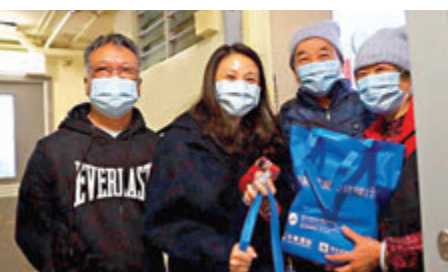
●「香港新界愛心送暖行動」向全港市民送出逾萬份愛心慰問福袋。

香港文匯報訊（記者 子京）香港新冠肺炎疫情依然嚴峻，基層市民生活倍加艱辛。近日，由新界社團聯合會社會服務基金主辦、華泰國際及滙豐全球通支持的「香港新界愛心送暖行動」在全港九區展開，向全港市民送出逾萬份愛心慰問福袋，鼓勵市民同心抗疫，共渡難關。