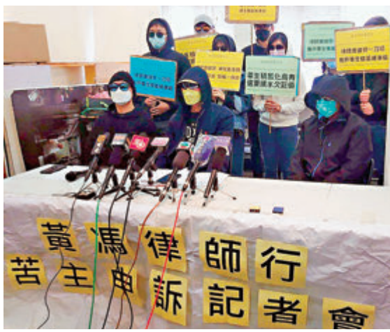
●彭韻儀表示，由於黃馮律師行賬目混亂，目前未有具體解凍及發還資金的時間表。圖為苦主早前召開申訴記者會。資料圖片

香港文匯報訊（記者 美釵）黃馮律師行因有前文員涉嫌挪用客戶款項，香港律師會上月24日行使法定權力接管該行。逾70名客戶經該行辦理樓宇買賣手續，並將總額1.2億元的印花稅、訂金、首期等存放在黃馮賬戶內，也被律師會一併凍結。昨日律師會召開記者會交代事件，該會會長彭韻儀表示，為保障當事人利益，別無他法才行使權力介入，又指若事先通知律師行，有機會使他們帶同客戶款項潛逃和銷毀文件。客戶如欲討回資金，必須得到法庭授權，核實資金誰屬，但由於黃馮的賬目混亂及不齊全，目前未有具體解凍及發還資金的時間表。