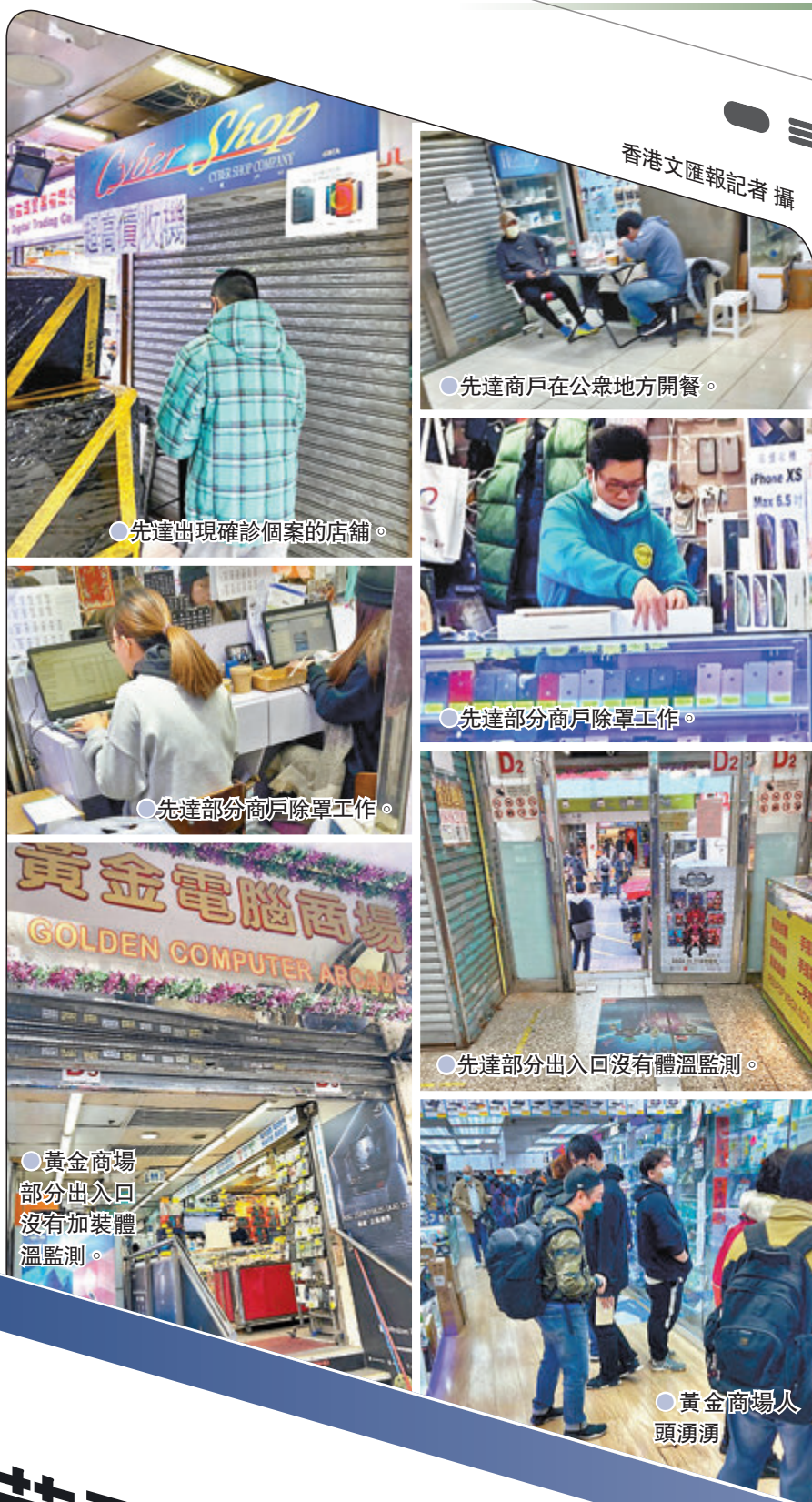
先達出現確診個案的店舖。