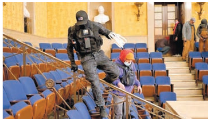
●有暴徒手持塑膠索帶。 網上圖片

美國國會於上周三被總統特朗普的大批支持者闖入，當時國會的警力明顯不足，令示威者「如入無人之境」。不少國會議員事後已提出，應正式成立委員會調查。不過美國政府近年已多次提醒，美國本土恐怖主義威脅日益嚴重，網上亦早有跡象顯示，極右陣營有意在當日發起激進行動，執法部門依然疏於防範，最終造成亂局。