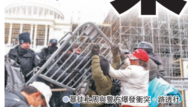
●暴徒上周與警方爆發衝突。