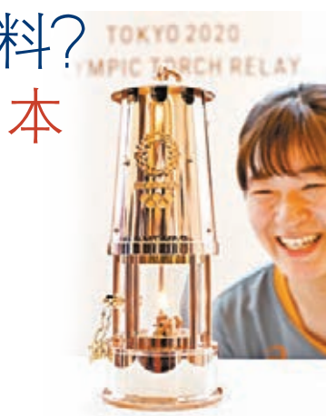
●因疫情嚴峻，東京日前宣布暫停奧運聖火展覽活動。

員龐德就在日前對BBC表態，無法保證今年夏天的東京奧運會能夠順利舉辦：「我不抱有確信。誰都不願談及，但病毒正在激增。」