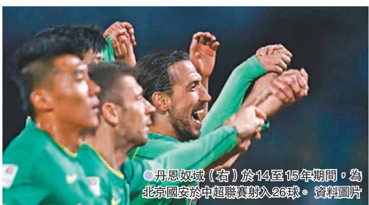
●丹恩奴域(右)於14至15年期間，為北京國安於中超聯賽射入26球。資料圖片

丹恩奴域擁有高大身形兼不俗的腳下功夫，由於踢法酷似瑞典球星伊巴謙莫域，因而獲得「黑山伊巴」的稱號，雖然他已經年屆39歲，不過仍然保持出色的入球能力，球會生涯上陣超過700場射入340球。曾三度榮膺韓職神射手的他上季效力大邱並射入9球。丹恩奴域在亞洲賽更堪稱傳奇級射手，歷來在亞冠盃攻入36球名列射手榜第2，僅落後第一名的李東國1球，今次加盟傑志有望衝擊射手榜榜首挑戰新紀錄。