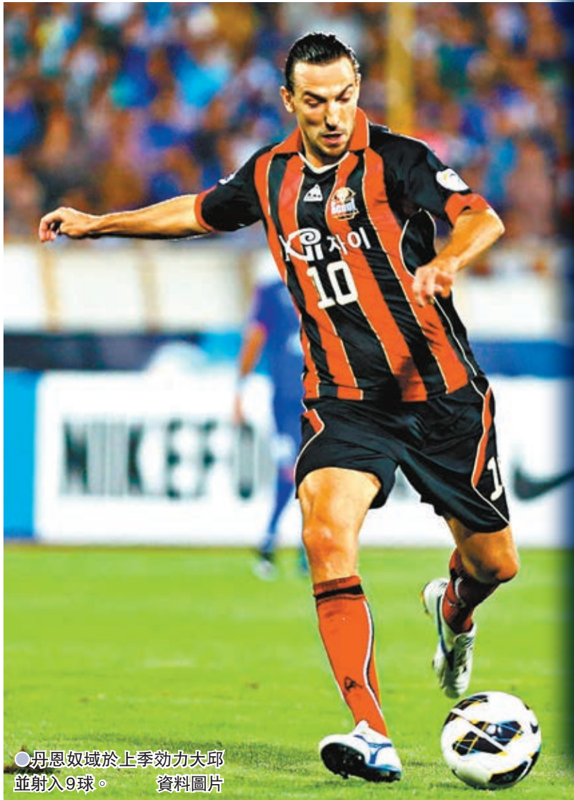
●丹恩奴域於上季效力大邱並射入9球。 資料圖片