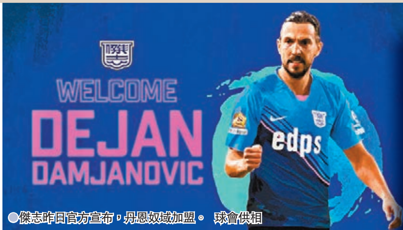
●傑志昨日官方宣布，丹恩奴域加盟。