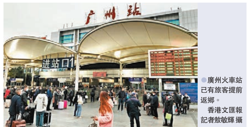
●廣州火車站已有旅客提前返鄉。

香港文匯報訊（記者 敏敏輝 廣州報道）春節臨近，不少人已提前計劃返鄉或旅行。根據內地購買火車票方案，1月9日可購買2月7日的車票，網上搶票迎來高峰。經查詢，以廣州、深圳出發為例，2月7日前往湖南、江西、四川、重慶、廣西、湖北等熱門方向的高鐵列車車票幾乎「開闢」即售罄，普速列車亦僅剩下少量的坐票或無座票。受訪旅客表示，目前內地零星散發疫情出現，防控形勢趨緊，但相信整體疫情能夠受控，在做好個人防護的前提下，還是會選擇返鄉過年。