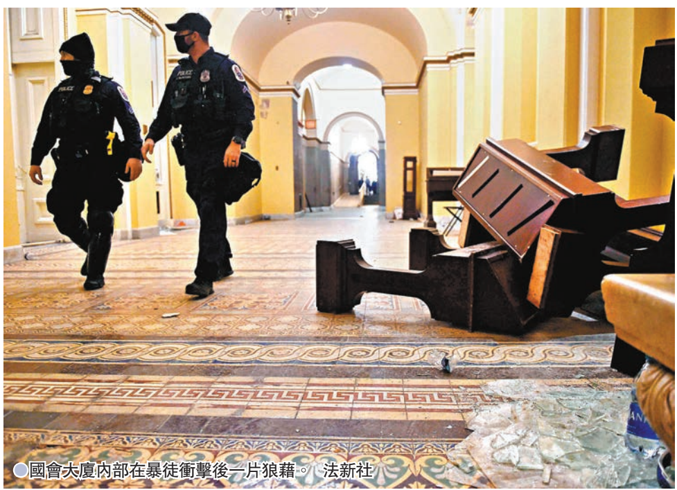
●國會大廈內部在暴徒衝擊後一片狼藉。