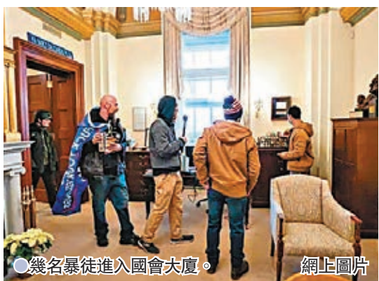
●幾名暴徒進入國會大廈。網上圖片

美國國會暴動發生後，數以百計未即刻被捕的暴徒趁亂逃離華盛頓，自以為能避過法律制裁。然而美國執法人員其實擁有大量追緝科技，既可透過網絡基建鎖定暴徒的手機，亦可透過當日現場無數短片及照片，以人臉識別技術對比全美公民容貌資料庫，查出暴徒身份，甚至透過公開暴徒照片呼籲公眾協助「點相」。這顯示在打擊罪行與保障個人私隱之間，美國執法部門絕對以前者為先，確保暴徒受到應得的法律制裁。