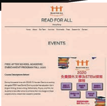
「Read for all」網上學習平台網站。

網上學習平台「Read For All」由現年17歲的魯麒（Clara）發起，她聯同於各範疇上學習出色的同學們一同製作課程，希望「以生命影響生命」，與香港學生分享於美國留學中所學的知識。「Read For All」平台於2016年成立，而從小就喜愛閱讀的Clara當時明白到身邊有些朋友未如她般幸運，能夠有機會閱讀不同的書籍，讓她萌生與他人共享資源的想法，因此創立「Read For All」平台讓書籍共享。而去年因肺炎疫情嚴峻，令原本在美國讀書的Clara留港，Clara於是便和另外兩名同學利用「Read For All」平台向香港的學生免費推出有關英語寫作、數學、物理、電影製作以及編劇創作的課程，「讓學生們能夠於疫情下，通過網上學習平台，以輕鬆的方式吸收知識。」Clara說。