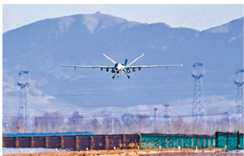
●「甘霖-I」人工影響天氣無人機成功首飛。

台灣大學政治系榮譽教授張麟徵接受採訪時表示，美國國務院此時宣布將與台灣當局進行政治軍事對話是特朗普離任前的瘋狂，想要製造混亂給即將上任的總統大選當選人拜登留下一個「爛攤子」，民進黨當局不必見獵心喜。