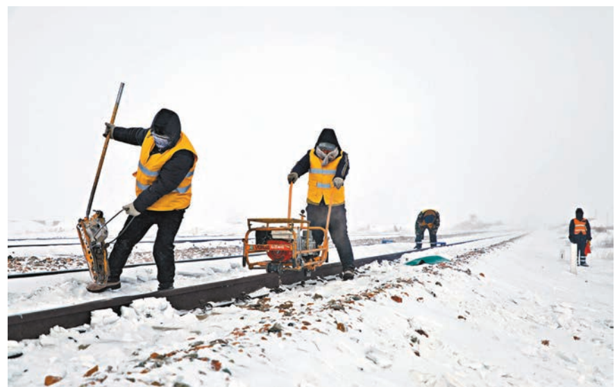
●受寒潮影響，內蒙古部分地區最低氣溫跌至-40℃。