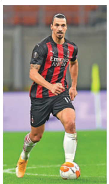
伊巴料可傷癒復出。

至於西甲方面剛有2名助教確診的巴塞隆拿於今晚深夜4時作客挑戰畢爾包，巴塞今季一直未能踢出勁旅本色，目前排名第5被馬德里雙雄拋離，今場面對實力一般的畢爾包，巴塞對3分志在必得。（now632台周四4：00a.m.直播）