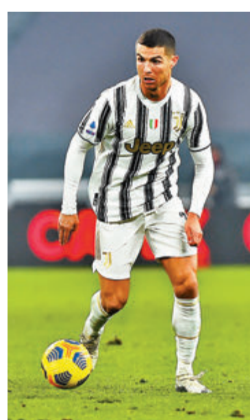
C朗拿度近況不俗。