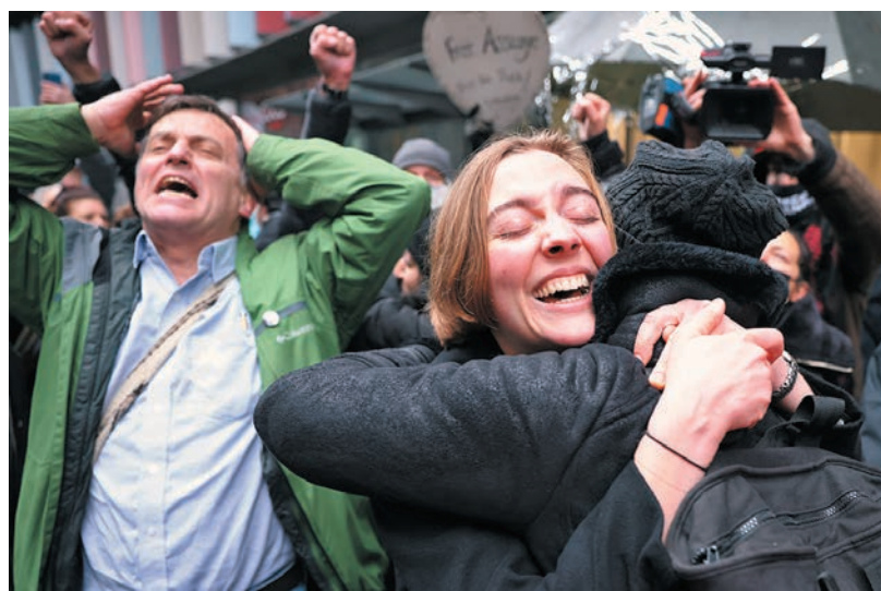
●阿桑奇支持者在庭外歡呼喝彩。