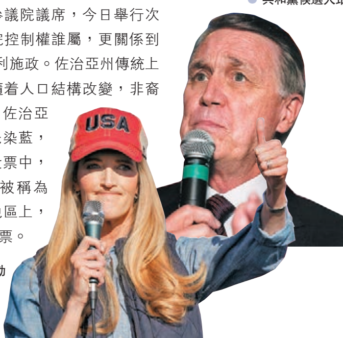
●共和黨候選人珀杜

佐治亞州首府亞特蘭大自上世纪七十年代起，已是非裔美國人主導的城市，不過決定佐治亞州選舉結果的，主要仍然是鄉郊地區選民，以及首府亞特蘭大以外的保守派、白人、福音派選民，過往佐治亞州亦從未選出非裔的州長及參議員。