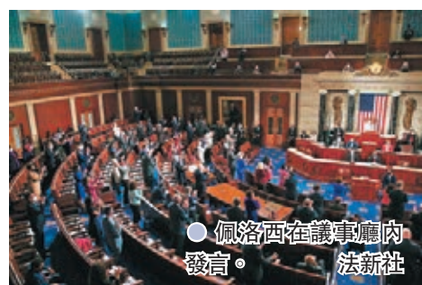
●佩洛西在議事廳內發言。