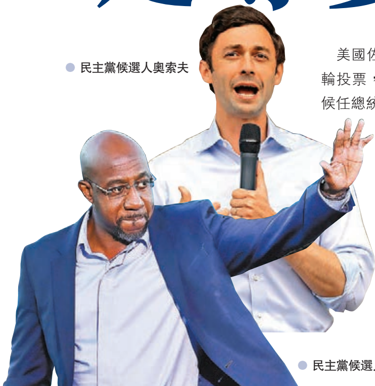
●民主黨候選人沃諾克

美國佐治亞州的兩個國會參議院議席，今日舉行次輪投票，選舉結果關乎參議院控制權誰屬，更關係到候任總統拜登未來4年可否順利施政。佐治亞州傳統上是深紅州份，不過隨着人口結構改變，非裔所佔比例愈來愈高，佐治亞州在去年大選已率先染藍，民主黨於今日次輪投票中，再次將希望押注在被稱為「黑人帶」的鄉郊地區上，力促非裔選民踴躍投票。