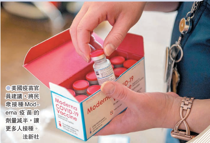
●美國疫苗官員建議，將民眾接種Moderna疫苗的劑量減半，讓更多人接種。

福奇同時稱，美國上週六新增近30萬宗確診個案，而根據感恩節假期的經驗，加上在英國發現的變種病毒已在美國傳播，他憂慮聖誕新年假期後的疫情可能飆升。對於總統特朗普指美國的疫情數據被誇大，福奇反駁特朗普的說法，「數字是真實的，我們有遠多於30萬人死亡，平均每日有2,000人至3,000人死亡，請走進醫院、走進深切治療部，看看發生什麼事，那是真實的數字、真實的人、真實的死亡數字。」