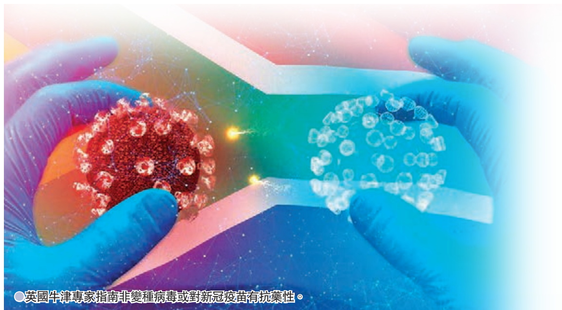
●英國牛津專家指南非變種病毒或對新冠疫苗有抗藥性。