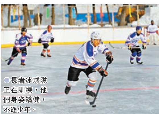
●長者冰球隊正在訓練，他們身姿矯健，不遜少年。

近日在吉林長春，一支由一群平均年齡在60歲以上的長者組建的冰球隊，每日按時在長春南湖公園的湖面上馳騁。據悉，這支老年冰球隊是2015年由一群冰球愛好者發起，2019年正式成立了長春復興冰上運動俱樂部。創隊逾5年，已有43名隊員，年齡最小的50歲，最大的72歲。每日下午1至3點，球隊都會進行訓練和比賽，冰場上隊員們身姿矯健，很難看出都是花甲之年的長者。