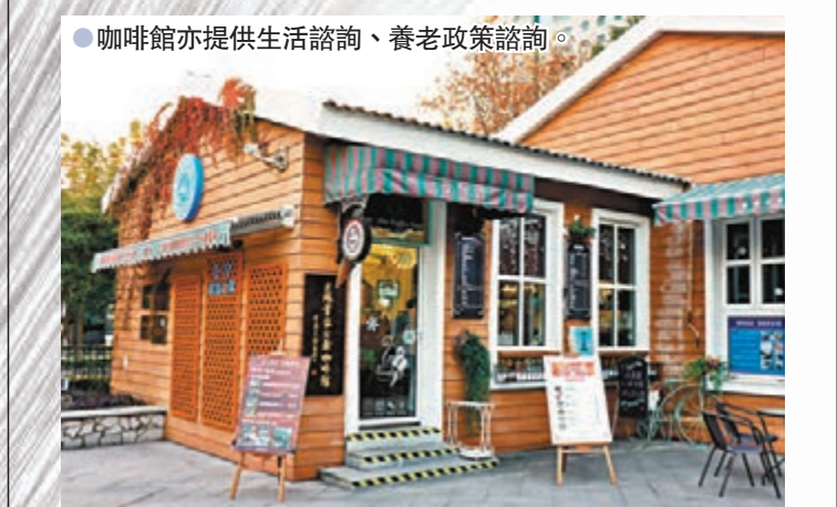
●咖啡館亦提供生活諮詢、養老政策諮詢。