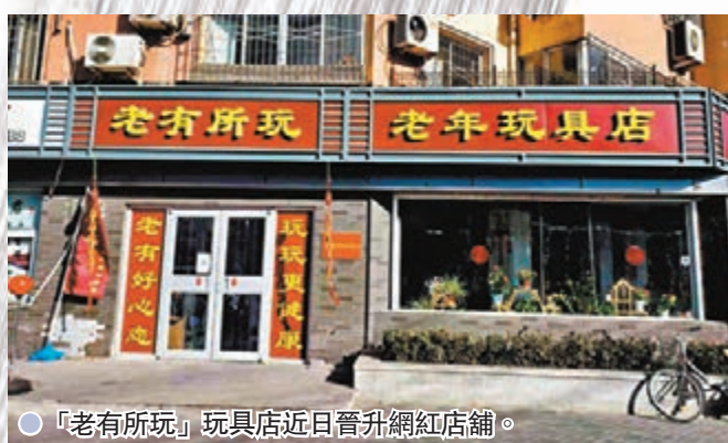
●「老有所玩」玩具店近日晉升網紅店舖。