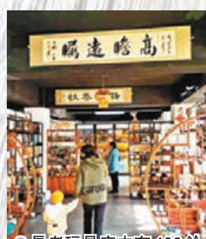
●長者玩具店內有400餘種懷舊玩具供長者選購。

最近，北京一家長者玩具店晉升「網紅」，不少人帶着七八十歲的父母來挑選玩具，更有不少長者在這裏相聚，遊戲裏回憶青春。這間於2020年重陽節正式開業的店舖，門口貼着「老有好心態，玩玩更健康」的對聯，店內擺放着400多種適合老年人的玩具，木質貨架兩側還設有健身運動區和益智休閒區，長者們可以在這裏玩飛鏢、騎四輪腳踏車繞圈，或是坐鞦韆、搖椅，玩棋牌、解環遊戲等。