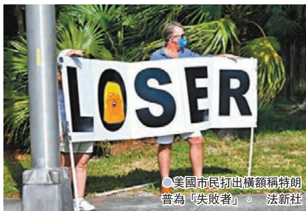
美國市民打出橫額稱特朗普為「失敗者」。

美國國會參眾兩院聯席會議將於本周三，點算去年大選各州選舉人票，正式確認民主黨候選人拜登當選下屆總統。這個往年只具象徵意義的程序，今年因為總統特朗普拒絕認輸，突然受到關注，包括「反華旗手」克魯茲在內的12名共和黨參議員前日表明，將會就選舉人票結果提出反對，副總統彭斯隨即表示「歡迎」。這次行動被視為特朗普陣營企圖推翻大選結果的「最後一博」，但肯定無阻拜登在1月20日就職，民主黨及部分溫和共和黨人均批評做法損害民主。