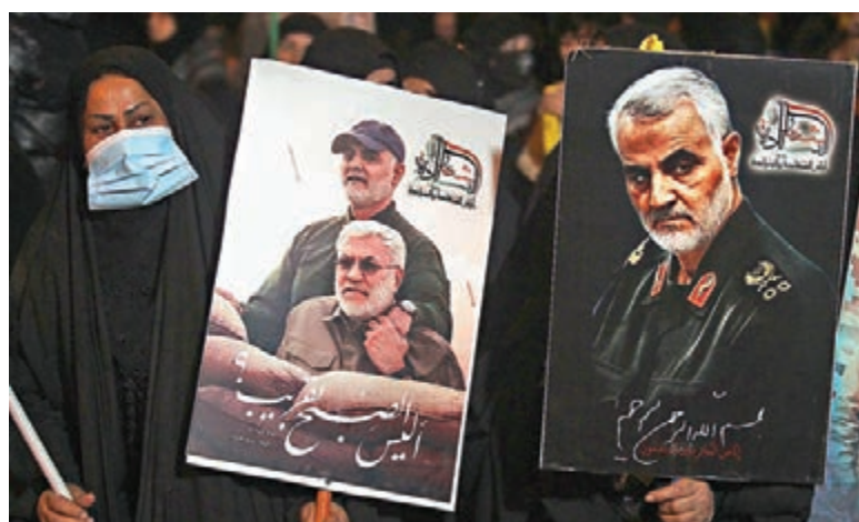
●伊拉克民眾悼念蘇萊馬尼與穆罕迪斯。

一周年愈趨緊張，雙方均指責對方正部署軍事行動，企圖開戰。伊朗外長扎里夫前日表示，希望美國總統特朗普不要