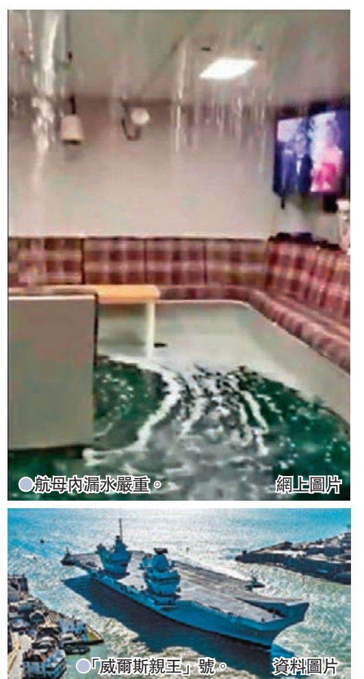
●航母內漏水嚴重。

國防部指出，新服役的航空母艦需要在海上試航，「威爾斯親王」號出海日子不反映真實工作量。海軍發言人表示，「威爾斯親王」號在今年進行升級、測試和試航後，未來會按照原定計劃執行任務。 ●綜合報道