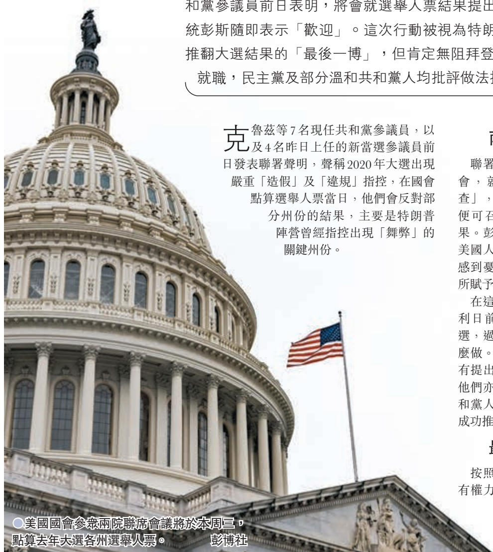
美國國會參眾兩院聯席會議將於本周三，點算去年大選各州選舉人票。

克魯茲等7名現任共和黨參議員，以及4名昨日上任的新當選參議員前日發表聯署聲明，聲稱2020年大選出現嚴重「造假」及「違規」指控，在國會點算選舉人票當日，他們會反對部分州份的結果，主要是特朗普陣營曾經指控出現「舞弊」的關鍵州份。