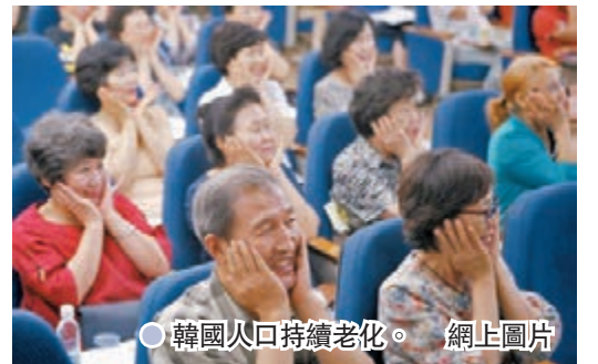
●韓國人口持續老化。