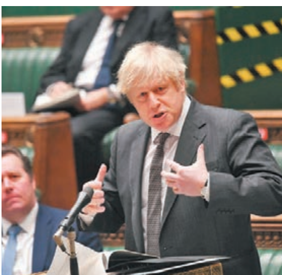
●在下屆大選，約翰遜可能議席不保。

英國新冠疫情持續失控，脫歐安排一團糟，令首相約翰遜及執政保守黨支持度大跌，最新民調顯示，保守黨下屆大選中或無法保住國會多數，約翰遜本人甚至可能議席不保，相反在野工黨則有望重建英格蘭北部「紅牆」，並有機會與支持「蘇獨」的蘇格蘭民族黨(SNP)共同執政。