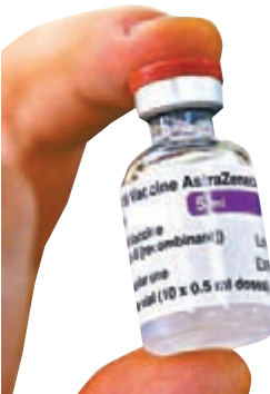
●英國當局初期會在少數醫院接種牛津疫苗。

英國前日再錄得57,725宗新冠肺炎確診個案，連續5日單日確診超過5萬宗。英國上月初起大規模接種輝瑞新冠疫苗，至今已為逾100萬人接種，今日開始牛津疫苗也會加入接種計劃，首批53萬劑疫苗已準備就緒。由於牛津疫苗接種程序較輝瑞疫苗簡單，當局目標一週內可為200萬人接種。 當局初期會在少數醫院接種牛津疫苗，首批優先為醫護和護老院員工接種，在確定接種者不會出現嚴重不良反應後，再分發至其他醫院和診所等數百個地點。有醫院表示，相信醫護在接種疫苗後，能夠更安心工作。 由於倫敦和附近地區疫情嚴重，區內學校在下一年押後開學，但英格蘭其他地區學校仍然如期在今日開學，引起教師團體不滿，有工會呼籲英格蘭所有學校延遲至少兩週開學，改為網上授課，並強調教師們有權拒絕在不安全的環境下工作。首相約翰遜則表示，現時學校仍然安全，並鼓勵家長讓學生回校上課，但不排除之後會進一步收緊防疫措施。