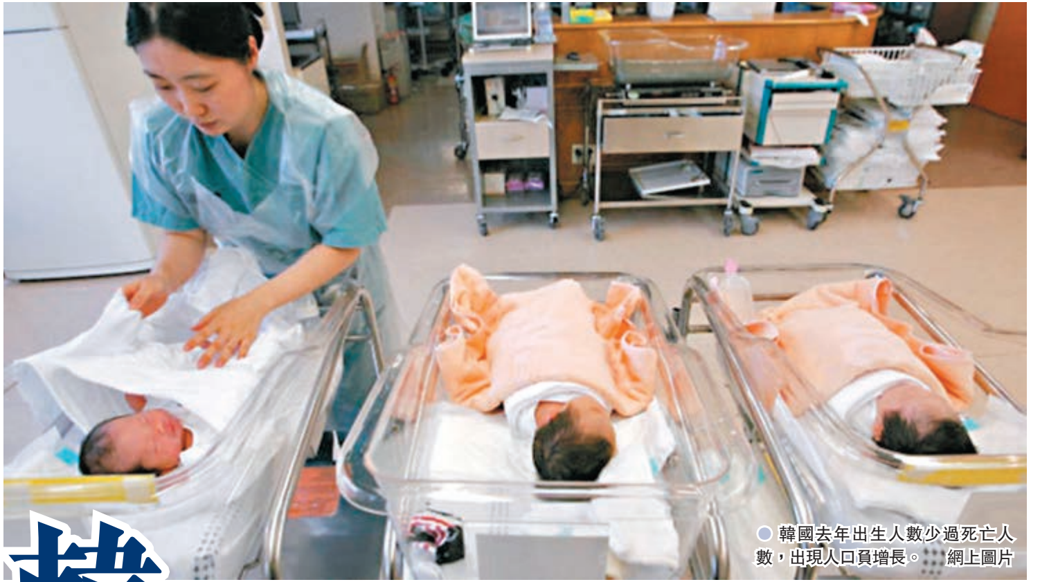
●韓國去年出生人數少過死亡人數，出現人口負增長。