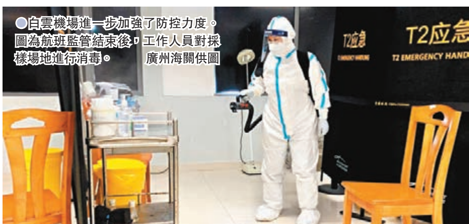
●白雲機場進一步加強了防控力度。圖為航班監管結束後,工作人員對採樣場地進行消毒。

本開展基因測序分析,初步提示為B.1.1.7突變株。1月2日經再次進行高通量測序覆核,結果顯示該病例樣本中病毒基因序列屬於B.1.1.7亞型。