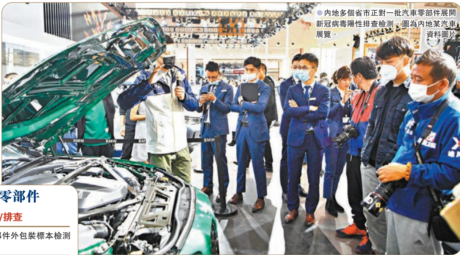
●內地多個省市正對一批汽車零部件展開新冠病毒陽性排查檢測。圖為內地某汽車展覽。資料圖片

香港文匯報訊(記者海巖 北京報道)新年伊始,內地多個省市正對一批汽車零部件展開新冠病毒陽性排查檢測,繼山東和山西發現陽性汽車零部件後,河北滄州、內蒙古呼和浩特市3日又通報,當地部分汽車零部件外包裝標本核酸檢測陽性,至此已在山東煙台、山東臨沂、山西晉城、河北滄州和內蒙古呼和浩特市5地發現陽性汽車零部件。對此,有關專家表示,鑒於早前內地出現不少進口冷鏈食品及外包裝表面檢出核酸陽性的情況,此次又由涉疫汽車零部件引發新冠病毒擴散風險,顯示常態化疫情防控不能鬆懈之外,亦要增強自我防護意識。