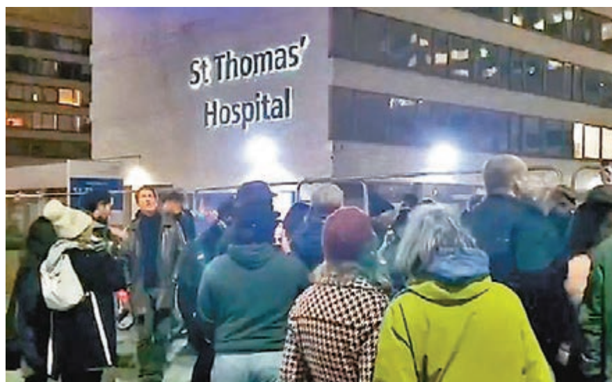
● 大批不戴口罩的人士於醫院外狂歡，大叫「新冠是騙局」。 網上圖片