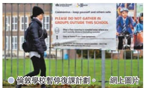
● 倫敦學校暫停復課計劃。