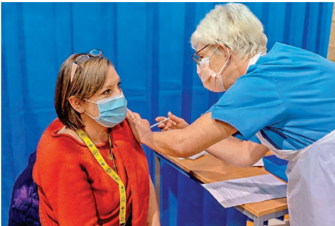
● 英國民眾或會接種兩劑不同藥廠生產的新冠疫苗，安全性成疑。 網上圖片

事實上，輝瑞疫苗使用信使核糖核酸(mRNA)技術，牛津大學疫苗則利用腺病毒載體、搭載病毒的脫氧核糖核酸(DNA)。根據兩