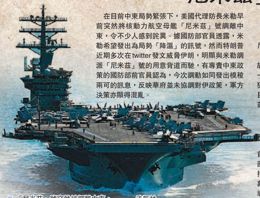
●「尼米茲」號突然被調離中東。