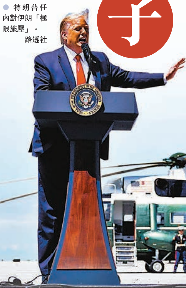
●特朗普任內對伊朗「極限施壓」。