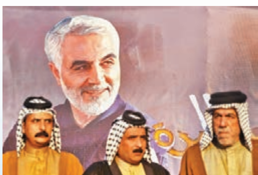
●不少伊拉克派系不滿美國特赦黑水保安。