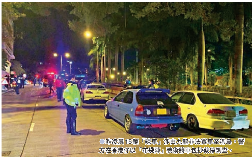
昨凌晨15輛「辣車」涉由九龍非法賽車至港島，警方在香港仔以「布袋陣」戰術將車包抄截停調查。