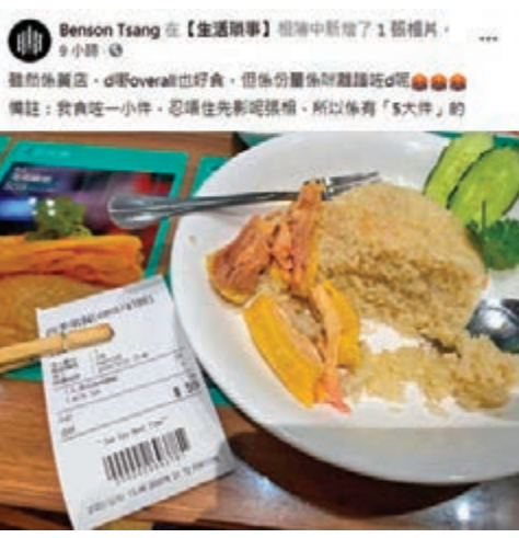
四季常餐被指泰式海南雞飯勁少雞。

網民「赤月善」日前都嘍「中伏飲食報料區」發帖問：「真係第一次嚟到要出post，屯門時代廣場呢間咁既貴茶……冬瓜茶除左(左)一啲冬瓜茶既(嘅)味都有之外，一浸油益味，我×××××臭×，一打開成陣油炸嘢味湧出黎(嚟)，懶×都有個譜呀！冬瓜茶咋，溝咋，唔好同我講咩經驗唔夠沖得唔好呀！……正正常常埋黎(嚟)買杯嘢飲你俾(界)屎水我？」「Choco Lau Pocar」都呻：「之前飲係嘅嘅珍奶茶，然後就無再飲。」見啲「同路人」鬧成咁，網民「Chi Wai