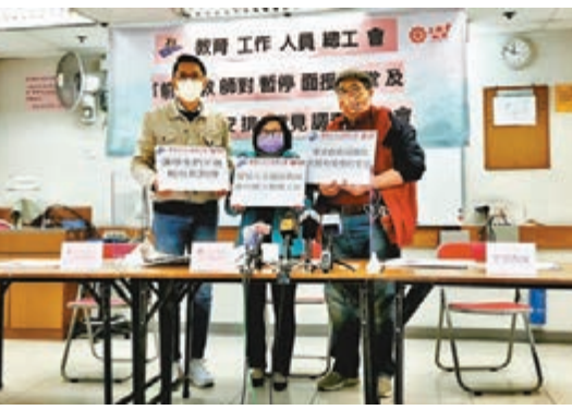
教總工會促請教局盡快公布小學呈分試與中學文憑試調節方案。

對教局容許學校讓小六、中六級的學生回校上課準備考試，59%教師贊同有關安排，認為面授效果始終比網課佳，亦能更好地評估學生學習水平。有出席記者會的中學教師指，持續網課讓學生未能用紙筆作答操練試題，認為會影響考試表現，他又說，曾聽聞有學生於網課時，將個人照片放在電腦鏡頭前，欺騙老師自己有出席。