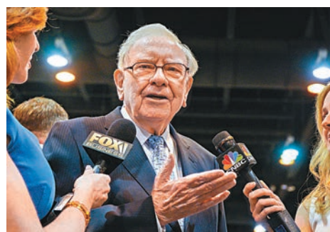
▲▲巴非特旗下的巴郡及沃爾瑪都曾裁減員工。