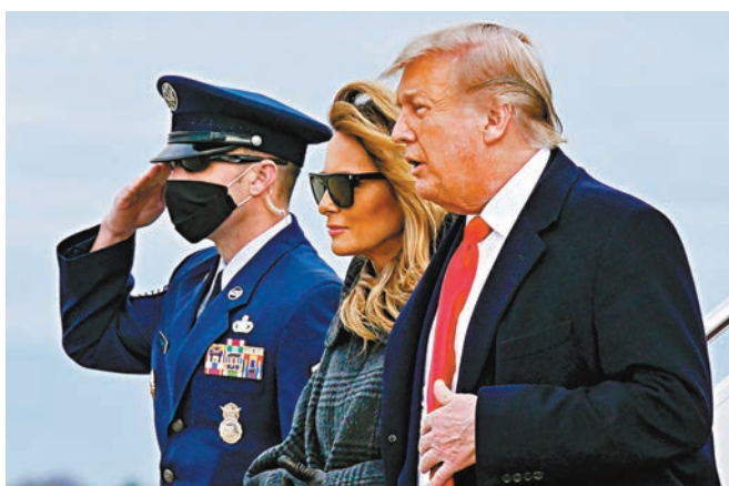
●特朗普未有盡早簽署紓困案，令國民無法及時獲得「應急錢」。

然而，美國貧富不均的問題其實早在疫情爆發前已出現，例如特朗普任內推出大規模減稅方案，實際上只使富人獲得大部分利益，聯合國在2018年一份報告中便點出這問題。同時，特朗普將紓困方案一拖再拖，令很多人無法維持生計，甚至露宿街頭。