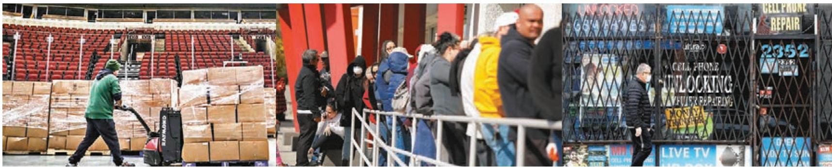
●芝加哥為有需要人士準備一箱箱食物。網上圖片 ●一職難求，招聘中心外大排長龍。網上圖片 ●不少商戶於疫情期間受到重創。網上圖片

美國的新冠疫情在全球最嚴重，已有超過34萬人疫歿，經濟更陷入衰退，然而去年美國股市卻大幅造好，道指更以30,606點的歷史高位「收年」。《華盛頓郵報》引述經濟學家分析指出，疫情導致美國失業率持續高企，數以百萬計民眾缺乏基本溫飽，大量小商戶倒閉，形容「股市絕不等於經濟」，投資者盲目相信新冠疫苗面世，便可迅速遏止疫情，但實際上疫情何時能受控仍是未知之數，美國經濟復甦步伐仍艱難。