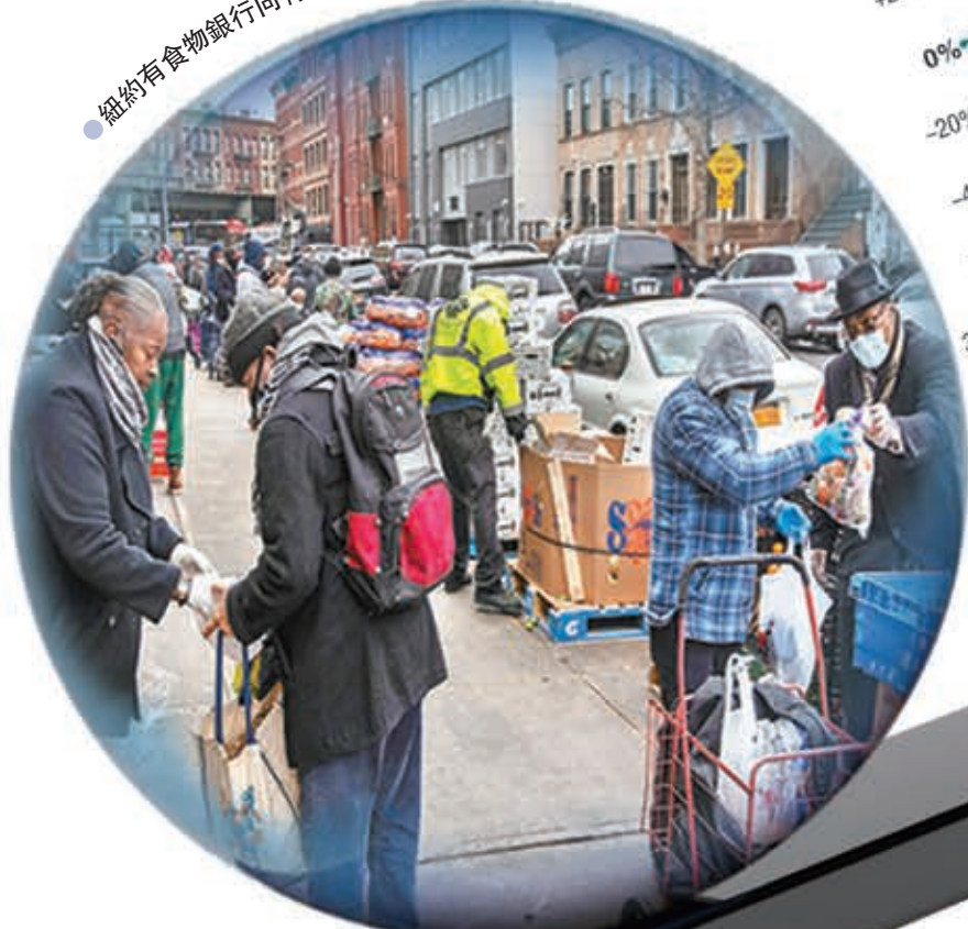
●紐約有食物銀行向有需要人士派發糧食。網上圖片