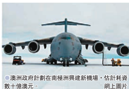
澳洲政府計劃在南極洲興建新機場，估計耗資數十億澳元。 網上圖片

英國《衛報》前日報道，澳洲政府計劃在南極洲興建新機場，方便全年調派研究人員來往兩地，估計耗資數十億澳元。《衛報》分析指出，澳洲興建跑道的原因之一，是試圖抗衡中國在南極的影響力。有專家批評澳洲政府此舉不但浪費金錢，亦可能觸發其他國家在南極展開「工程競賽」，嚴重破壞生態環境，形容澳洲政府是以科學為名，立下極壞先例。