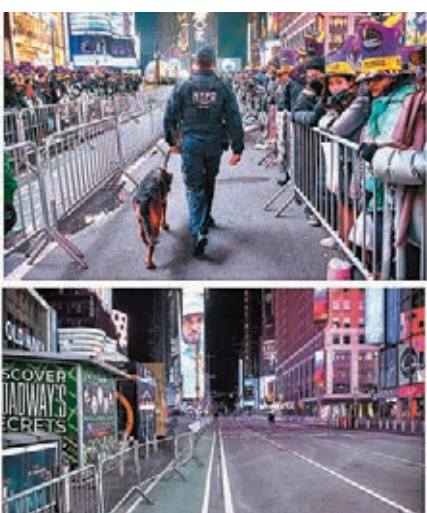
2020 年除夕下的紐約時代廣場內空無一人(下圖)，與 2019 年除夕形成極大對比(上圖)。

在新冠疫情肆虐下，全球各地的跨年活動大受影響，多國取消或縮減慶祝活動，呼籲民眾留家迎接新年，往年的熱鬧氣氛不再。美國紐約時代廣場一向是全球跨年活動焦點，今次雖照常舉辦倒數活動，但不向公眾開放，只有數百人獲邀參加，部分醫護人員也作為特別嘉賓出席。倒數活動流程與往年相同，但缺少數十萬計民眾的歡呼聲，廣場空空如也，氣氛相當冷清。在疫情同樣嚴峻的歐洲，法國取消凱旋門的跨年燈光和煙花匯演，在除夕當晚 8 時開始實施宵禁，出動 10 萬警力巡邏，巴黎市中心的香榭麗舍大道幾乎空無一人。總統馬克龍按照傳統，在電視上向全體民眾發表新年演說，表示受疫情影響，今年跨年活動與往年不同，並向醫護人員致謝。英國倫敦在除夕夜前封鎖各個跨年活動熱門地點，避免群眾聚集。日本近日確診人數上升，皇室取消傳統的新年參賀，東京澀谷的跨年活動全部停辦。明治神社取消跨年通宵參拜活動，昨日 6 時才重新開放，但貼上要求民眾保持社交距離的告示，前往參拜的人數亦較去年減少超過一半。 ●綜合報道