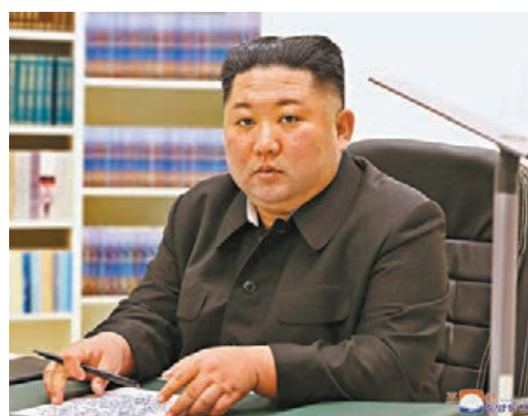
金正恩連續第二年沒有親自發表新年賀詞。