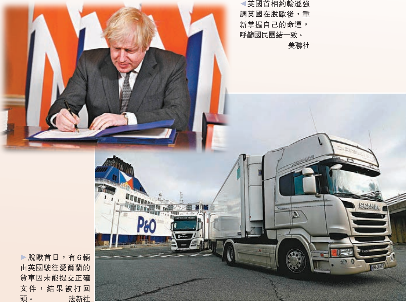
英國首相約翰遜強調英國在脫歐後，重新掌握自己的命運，呼籲國民團結一致。

英陷「身份危機」 重挫公信力 英國首相約翰遜在新年賀詞中，強調英國在脫歐後，重新掌握自己的命運，呼籲國民團結一致。但有英國民眾形容脫歐是「災難」，坦言看不到有任何好處。法國總統馬克龍亦對英國脫歐大潑冷水，認為脫歐是「許多謊言和不實承諾」的結果。有歐盟專家指出，約翰遜等英國政客作出政治豪賭，透過謊言煽動國民脫歐，令英國不但陷入「身份危機」，亦在國際社會上失去公信力。歐盟脫歐談判代表巴尼耶表示，沒人能說明脫歐的好處，形容「你無法慶祝分手」。德國國際與安全事務研究所研究員昂德薩稱，約翰遜政府推出具爭議的《內部市場法案》，試圖違反脫歐協議中有關愛爾蘭與北愛邊境安排的條款，如同漠視國際法，重挫英國的公信力。 ●綜合報道