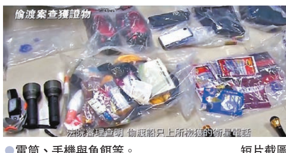
●電筒、手機與魚餌等。 短片截圖

短片續指，「12逃犯」中，8人被判處7個月監禁，且判決執行之前，已經被採取刑事拘留強制措施，羈押一日就抵扣一日刑期，意味着刑期可以大幅度縮短。該案在刑