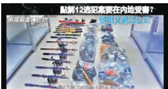
●偷渡案查獲的證物、魚竿等。 短片截圖

香港文匯報訊(記者 鄭治祖)深圳鹽田區人民法院日前就「12逃犯」案宣判，案中10人被判有期徒刑7個月至3年不等，案發時未成年的兩人獲不起訴並已遣返返港。深圳衛視旗下的「直新聞」日前發布3條短片，解釋有關「12逃犯」一案的量刑及各項權利的保障，並展示了案件相關的證物，包括遊艇、多支魚竿及其他釣魚用具、電話及電筒等等，其中一袋證物寫有案件發生日期8月23日，即案發日期，性質屬偷渡案。