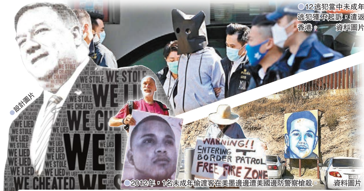
○12逃犯當中未成年逃犯獲不起訴，遣返香港。 資料圖片

工聯會立法會議員陸頌雄表示，蓬佩奧最擅長就是顛倒是非、講大話。「12逃犯」是偷渡觸犯了偷越邊境罪，既然犯法當然要承擔一切的法律責任，蓬佩奧卻歪曲事實，為抹黑中國而胡說八道，不但是國際笑話，更令人感到蓬佩奧是為了掩飾美國內部的混亂，包括總統選舉和無能力控制新冠肺炎疫情等事項，他圖借抹黑中國來轉移美國民眾對政府的不滿情緒。