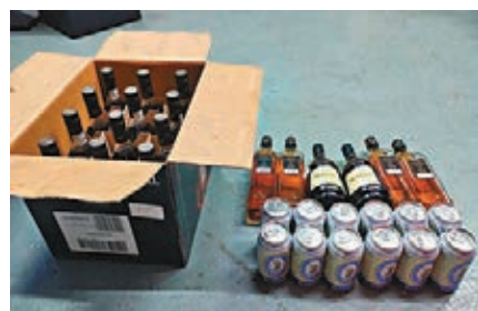
●警方檢獲大量酒類。