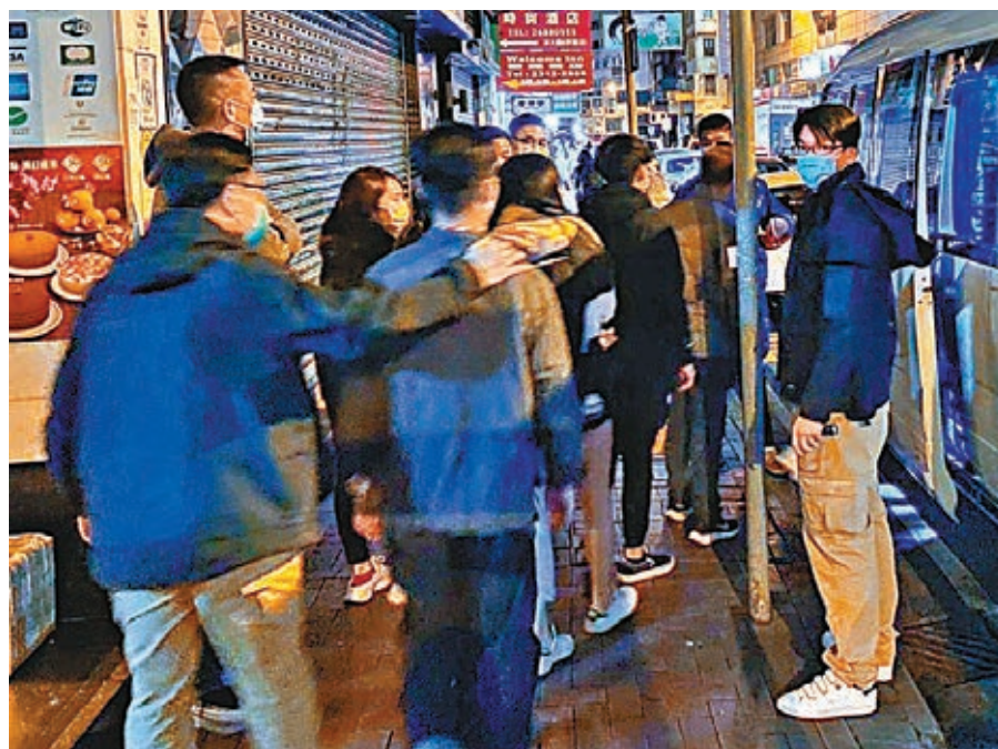
●警方在尖沙咀搗破兩間樓上酒吧及無牌酒吧，共拘捕31人分別涉嫌違反限業令及限聚令。

及大量音響器材等，共拘捕71人，當中4名男負責人涉嫌無牌售賣酒類飲品違反限業令，其餘39名28女顧客另涉嫌犯聚共被罰款33.5萬元。