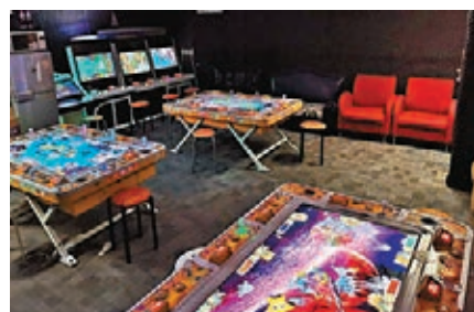
●警方在紅磡搗破一個非法賭場檢獲釣魚機及射擊遊戲機等證物，15名賭客涉嫌犯聚被票控。