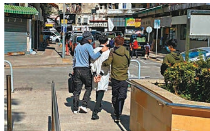
●警方在葵青區搗破4間派對房及無牌酒吧行動中，拘捕5名男子涉無牌賣酒及違反限業令。

間，其中兩間違規營業，同時發現工廈內的無牌酒吧，共拘捕33人，年齡介乎13歲至53歲，涉嫌「無牌售賣酒類飲品」、「無牌藏有酒類飲品可作販賣用途」、「在無領取牌照的地方飲酒」及違反限業令，人員將向被捕者作出檢控或票控。