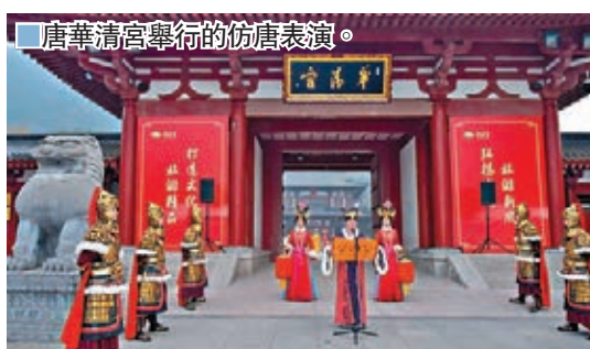
唐華清宮舉行的仿唐表演。