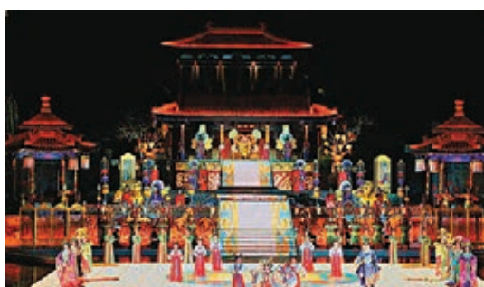
《長恨歌》實景演出舞台設計十分有層次感。