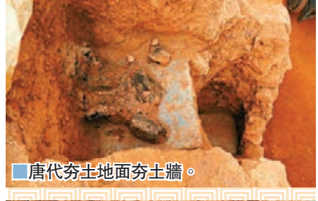
唐代夯土地面夯土牆。