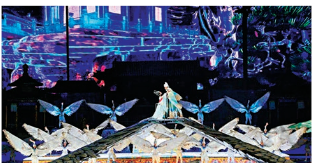
華清宮《長恨歌》實景演出再現唐玄宗與楊貴妃迴旋宛轉的愛情故事。