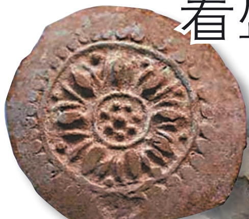
朝元閣遺址出土大量唐代磚瓦。