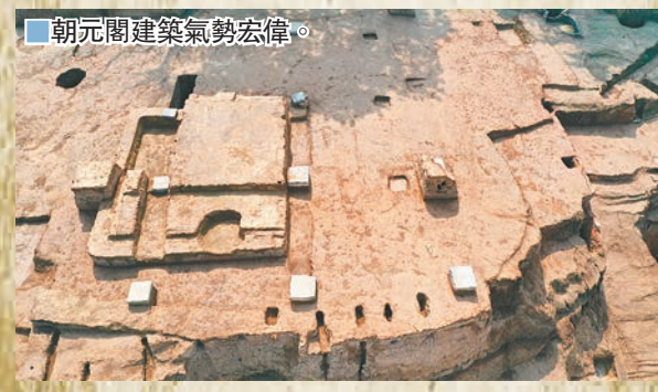
朝元閣建築氣勢宏偉。

據悉，安史之亂後唐王朝由盛轉衰，中晚唐時期，唐帝王便很少遊幸華清宮，朝元閣隨之漸趨衰朽，最晚至北宋開寶三年（公元970年）徹底塌毀。