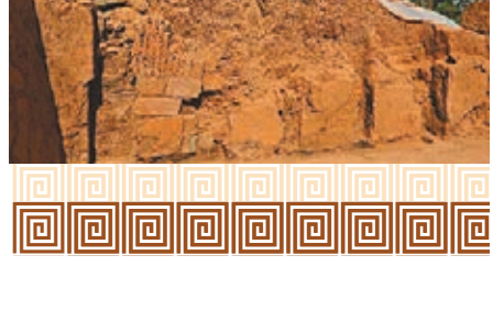
朝元閣遺址出土中原地區罕見的地標。