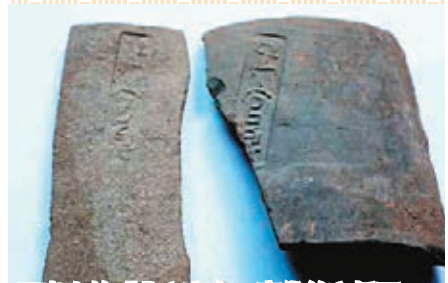
出土的「北六官泉」唐代銘文板瓦。