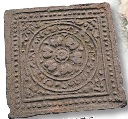
朝元閣遺址出土的灰陶磚瓦。

「春寒賜浴華清池，溫泉水滑洗凝脂。侍兒扶起嬌無力，始是新承恩澤時。」唐代詩人白居易的千古名作《長恨歌》，不僅形象敘述了唐玄宗與楊貴妃迴旋宛轉的愛情悲劇，同時也讓今人有機會一窺大唐皇家園林華清宮當年的極盡奢華。香港文匯報記者日前從陝西省考古研究院獲悉，該院考古人員2020年對唐華清宮朝元閣遺址建築群進行了發掘和清理。經考古發掘證實，朝元閣不僅是唐華清宮驪山禁苑內規模最大的建築群，也是迄今為止發現的唯一唐代高台建築遺址，代表着盛唐皇家建築設計的最高水平。