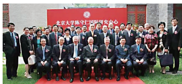
▲北京大學陳守仁國際研究中心開揭開幕典禮