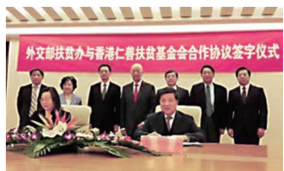
▲仁善扶貧基金會2016年與外交部扶貧辦合作首推一千元產業扶貧幫扶資金