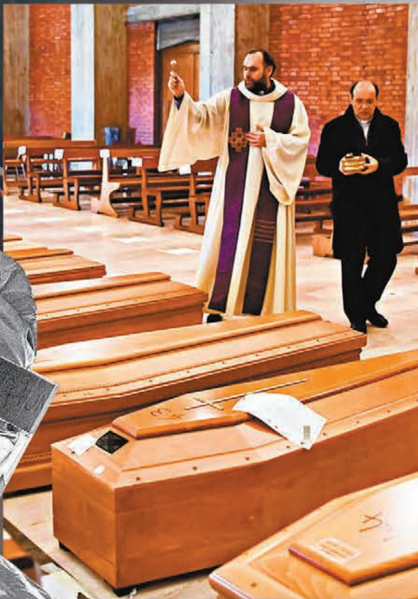
► 疫情奪取無數人命，意大利3月時有教堂放滿疫歿者的棺材。