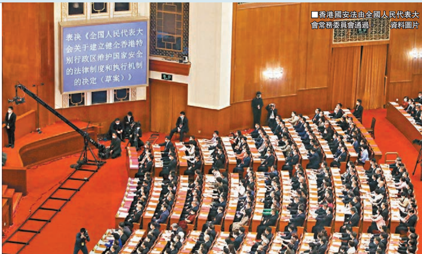
香港國安法由全國人民代表大會常務委員會通過。資料圖片

香港國安法生效至今已半年，成效可謂立竿見影，社會明顯由亂向治，市道復平穩。資料圖片