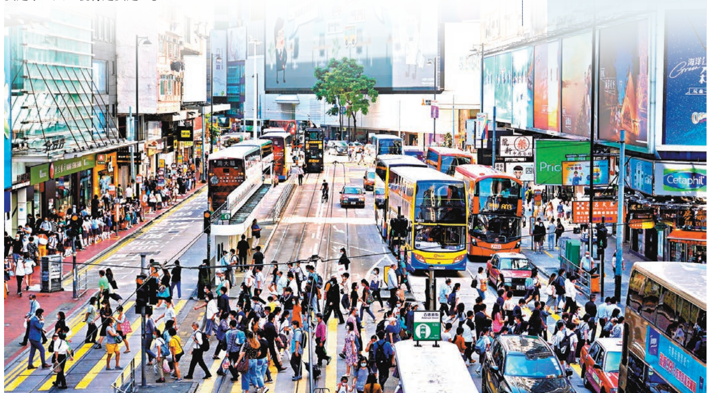
資料來源：香港警務處、網上資料 整理：香港文匯報記者 鄭治祖