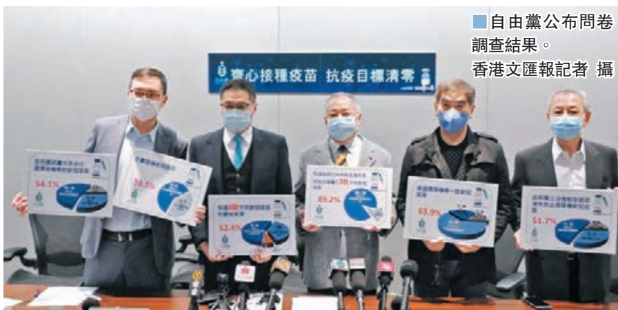
自由黨公布問卷調查結果。