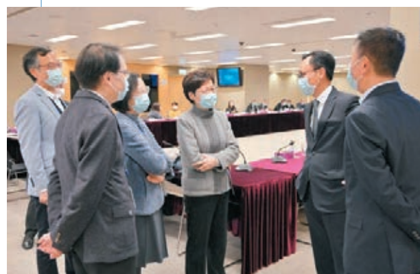
疫苗專家顧問委員會昨召開首次會議，林鄭月娥出席並向成員致謝。

自由黨在本月22日至27日進行有關調查，以電話隨機訪問了2,691人。結果顯示，在1,600名表示有意接種疫苗的市民中，有逾五成人表示政府應立即強制全部居港市民接種疫苗，亦有超過一半的人贊同政府應給市民自行選擇接種哪款疫苗。