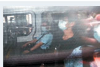
鍾翰林昨被裁定侮辱國旗及非法集結罪成，判監4個月。