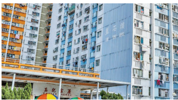
▲政府決定收緊大廈強制檢測的指引。昨日瀝源邨榮瑞樓和坪石邨藍石樓符合新規定，居民須強制檢測。資料圖片

頭，亦不會抽起強制檢測令。至於新冠肺炎疫苗的情況，徐德義表示相關工作仍在進行。他指出，在相關法例第599K章訂立之後，政府會進行跟