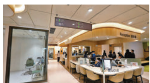
■中大醫院將於1月6日啟用。

據悉，醫院啟用後，首三個月開放專科門診、急症門診、眼科門診及內窺鏡服務，其他服務則之後陸續開放。人手方面，首階段會有15名駐院醫生及70名護士；提供8個住院病床，及12個日間住院病床，方便病人完成內窺鏡後休息，或提早入院。急症科門診首三個月營業時間為早上9時至晚上6時；4月起延長至晚上8時；10月起24小時營業。