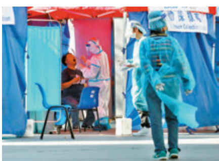
■政府在聯合醫院外設置檢測站。

她續指，現時社區很多隱形個案，提醒同事為病人做口部護理、清潔、餵食的程序時，必須佩戴護目鏡、面罩、保