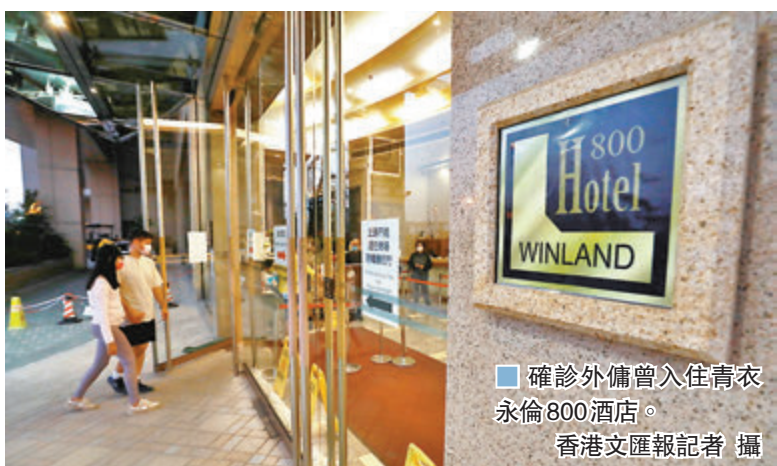
■確診外傭曾入住青衣永倫800酒店。

香港文匯報訊（記者 文森）昨日新增的3宗新冠肺炎輸入個案，包括一名潛伏期特別長的印傭。該印傭抵港後入住酒店並完成14天檢疫，之後在社區活動最少3天，到過旺角、將軍澳及青衣，是繼早前確診英國留學生後，另一名完成14天檢疫後才發現的輸入病例。