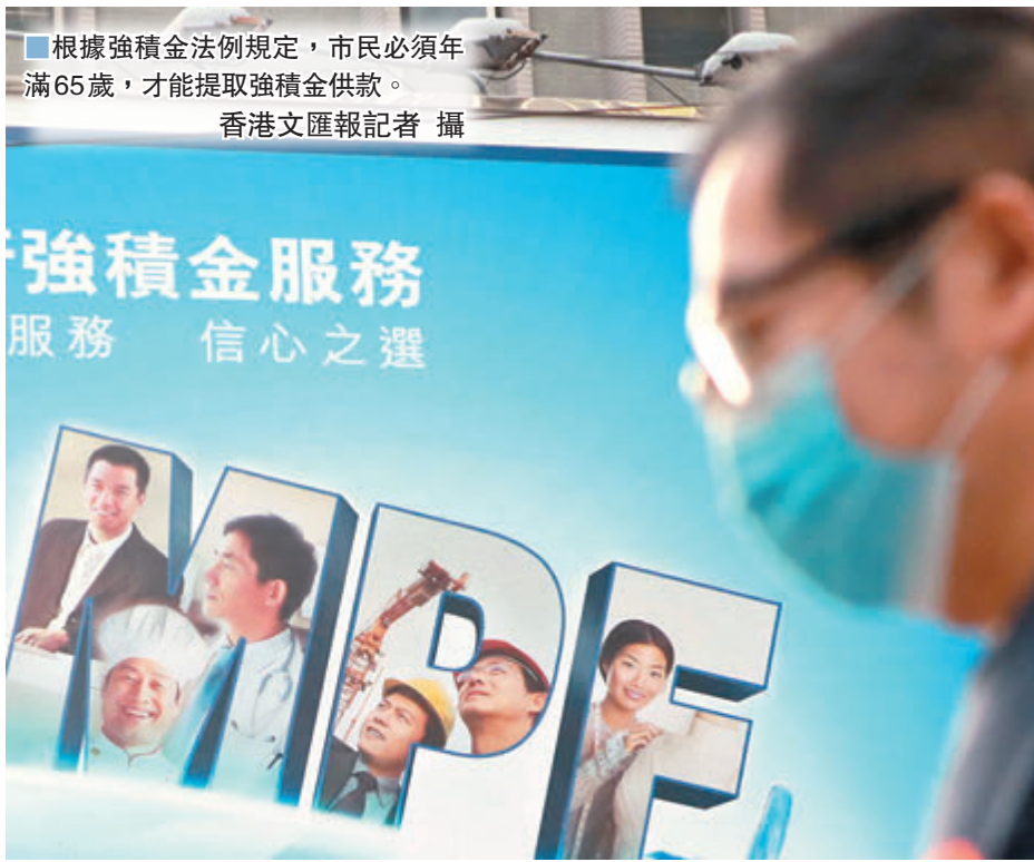
■根據強積金法例規定，市民必須年滿65歲，才能提取強積金供款。

他聲稱，積金局審批「鬆手」下，審批時間短促，「只需要一兩個月。」與之前一名中介一樣，對方在記者領取強積金後，發出一