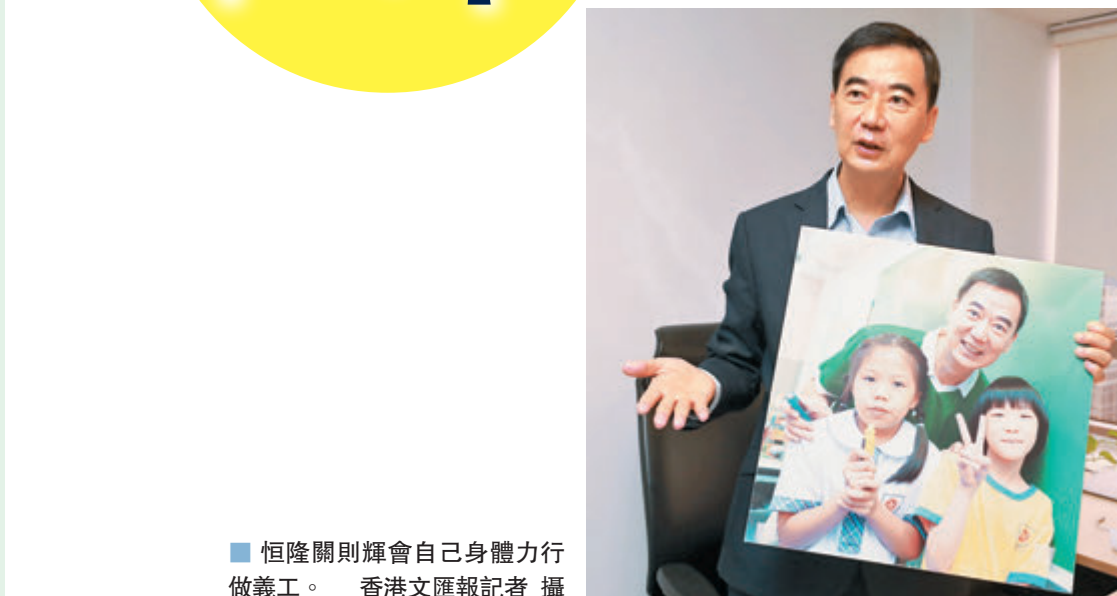
■恒隆關則輝會自己身體力行做義工。