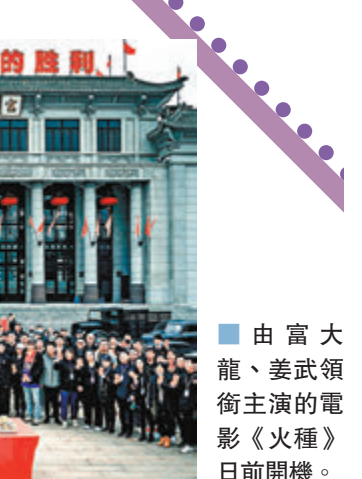
由富大龍、姜武領銜主演的電影《火種》日前開機。

日前介紹,《火種》從一份塵封的神秘檔案切入,通過雙時空劇情設置,立足於李大釗引領的時代先鋒思潮,力求與當代青年的價值觀形成共情共振,實現跨越百年的信仰對話。