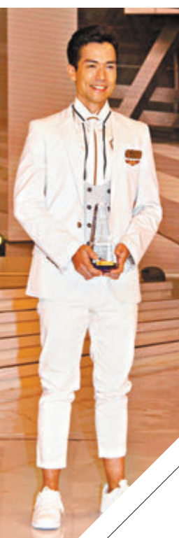
麥大力稱今次比賽是個很好的經驗,並會入行做藝人。