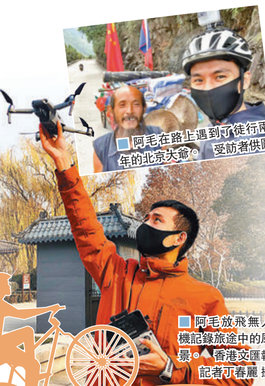
■阿毛在路上遇到了徒行兩年的北京大爺。