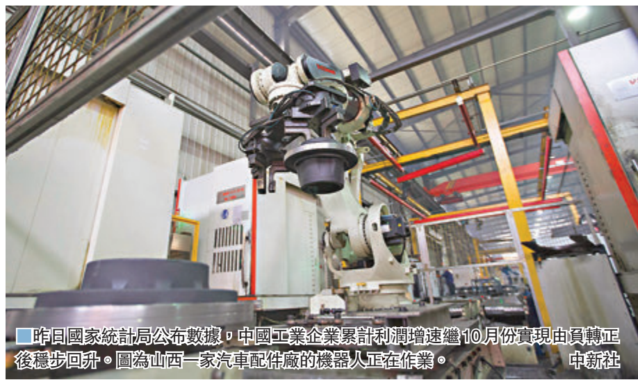
■昨日國家統計局公布數據,中國工業企業累計利潤增速繼10月份實現由負轉正後穩步回升。圖為山西一家汽車配件廠的機器人正在作業。

香港文匯報訊(記者 海巖 北京報道)內地工業生產向好,工業企業累計利潤增速繼10月份實現由負轉正後穩步回升。國家統計局27日發布數據顯示,1月至11月規模以上工業企業利潤同比增長2.4%,較1月至10月加快1.7個百分點,營業收入增速年內首次轉正,單位成本則錄得年內首次下降,帶動利潤率改善,盈利上升。