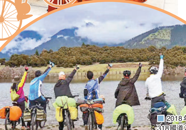
■2018年阿毛和騎友們騎行318國道入藏。受訪者供圖