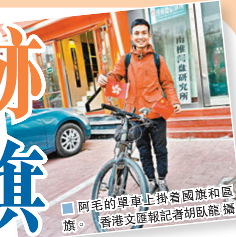
■阿毛的單車上掛着國旗和區旗。