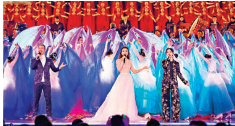
■中國香港演員容祖兒、中國澳門演員夏利奧、歌手周筆暢將一起演唱《共同家園》。

香港文匯報訊 2021年新年,中央廣播電視總台《2021新年音樂會——揚帆遠航大灣區》將與海內外廣大觀眾見面,用最美樂音迎接新年新氣象。這台音樂會首次由中央廣播電視總台、廣東省人民政府、香港特別行政區政府、澳門特別行政區政府共同主辦,通過「同心粵港澳·樂迎新年」、「追夢大灣區·躍動世界」、「幸福粵港澳·粵立潮頭」、「揚帆大灣區·悅向未來」四大篇章,全方位呈現粵港澳大灣區發展建設一盤棋,同根同源齊追夢的壯麗時代畫卷。