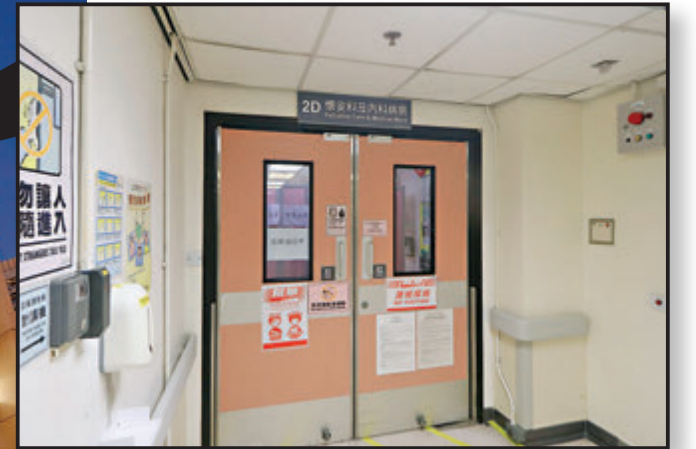
政府刊憲要求所有曾在本月15日至27日到聯合醫院2D懷安科病房以及深切治療部逗留過的人士，均須接受強制檢測。圖為聯合醫院2D懷安科病房。

吃」，他估計病毒經空氣傳播，空氣由病區最近的窗口吹出，經走廊到護士站而造成今次爆發，「唔排除其他可能性，例如會唔會經過接觸、經過飛沫、因為無戴護目鏡等等而引起傳播。」他認為最重要是先處理病房的爆發，指出雖是第一次在香港正式有醫護人員群組爆發，但應可控制，而他建議要做好入院篩查，若病徵持續再去做測試，減少假陰性結果。