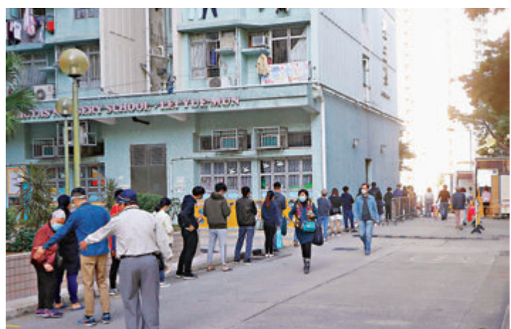
地面貼有黃色膠帶，提醒排隊居民保持適當距離，有工作人員現場指引。