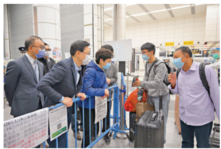
林鄭月娥（左三）在深圳灣管制站與一對透過「回港易」計劃返港的父子交談。

香港文匯報訊（記者 文森）行政長官林鄭月娥昨日到訪深圳灣管制站及港珠澳大橋管制站，了解豁免香港居民從廣東省或澳門回港檢疫安排的「回港易」計劃實施情況。據匯報，指出計劃運作暢順，實施至今約一個月，已有近兩萬名香港居民從廣東省或澳門透過計劃回港而獲豁免強制檢疫安排。