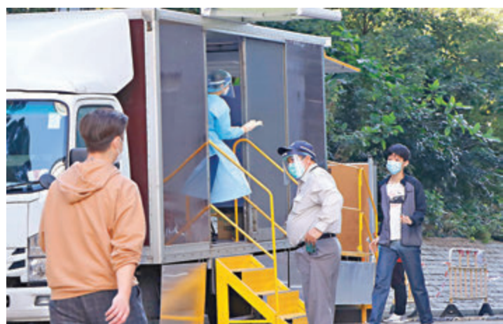
鯉生樓旁昨日設置兩輛流動採樣車為居民提供採樣服務。

香港文匯報訊（記者 文森）油塘鯉魚門郵政總局昨日設置4個單位共6人確診，全幢大廈住戶及曾到訪人士須強制檢測，鯉生樓旁昨日設置兩輛流動採樣車為居民提供採樣服務，不少前往檢測的居民擔憂大廈環境有污染，亦有市民指已習慣疫情新常態，特殊時期更要以平和心態傳遞防疫正能量。