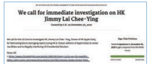
有網民上月30日發起聯署，要求美國政府調查黎智英是否涉及發布虛假訊息及非法干預大選，有關聯署截至昨晚深夜已有逾10萬人簽署。 網上截圖