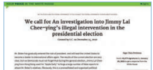
白宮網站日前再多一份要求調查黎智英的聯署。