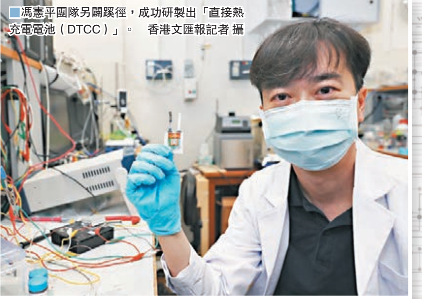
馮憲平團隊另闢蹊徑，成功研製出「直接熱充電電池(DTCC)」。