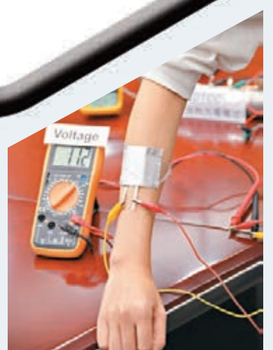
DTCC貼身體上可用體溫為智能科技產品供電作醫療監測。