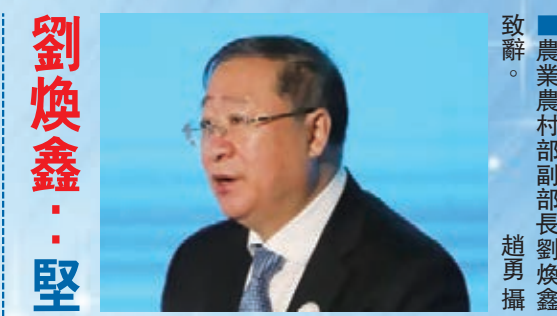
農業農村部副部長劉煥鑫致辭。