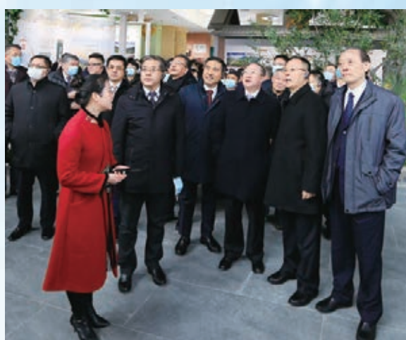
中外嘉賓康縣鄉村考察。