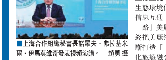
上海合作組織秘書長諾羅夫·弗拉基米爾·伊馬莫維奇發表視頻演講。