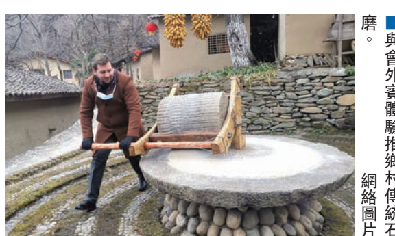
與會外賓體驗推磨村傳統石磨。

23日，以「開發鄉村價值、建設美麗鄉村」、「拓展鄉村功能、促進文旅融合」、「發展現代絲路寒旱農業、促進『一帶一路』沿線合作交流」為主題的「美麗鄉村建設論壇」、「文旅康養賦能美麗鄉村論壇」、「『一帶一路』農業合作論壇」三場分論壇在隴南市武都區舉行，專家報告、學術沙龍、嘉賓訪談，多形式深入探討發展具體問題，並集中展示美麗鄉村建設成果，現場精彩紛呈。