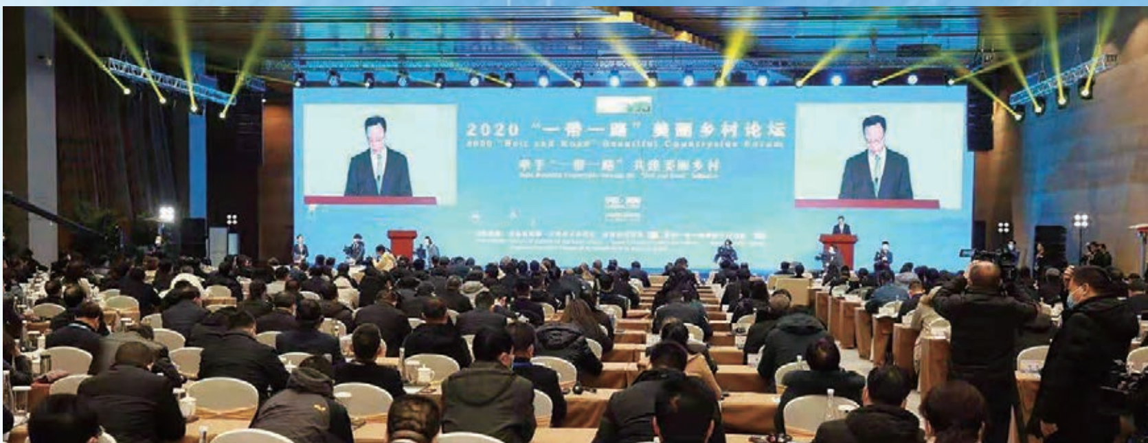
「一帶一路」美麗鄉村論壇在隴南市康縣「一帶一路」美麗鄉村大聯盟論壇永久會址開幕，甘肅省委副書記孫偉致辭。

泰國駐華大使阿塔育·習薩目、尼泊爾駐華大使馬亨德拉·潘迪、巴基斯坦駐華大使莫因·哈克及聯合國世界糧食計劃署駐華代表處、上海合作組織秘書處、聯合國可持續發展農業機械中心等20多個國家和國際組織代表與會。中國農業農村部原黨組副書記、副部長余欣榮，世界旅遊聯盟主席段強、中國農業發展銀行副行長徐一丁等出席論壇。