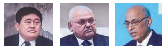
泰國駐華大使阿塔育·習薩目

中國農業發展銀行副行長徐一丁表示：作為我國唯一和全世界規模最大的農業政策性銀行，將切實發揮政策性金融重要作用，全力支持建設「天藍、地綠、水清、路暢、城美、人旺、業興」的美麗鄉村。全力支持產業發展，為美麗鄉村建設「築根基」；全力支持改善人居，為美麗鄉村建設「煥新顏」；全力支持綠色生態，為美麗鄉村建設「注生機」；全力支持鄉村旅遊，為美麗鄉村建設「譜新篇」。