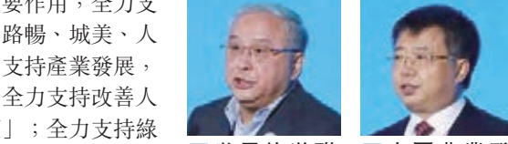
巴基斯坦駐華大使莫因·哈克