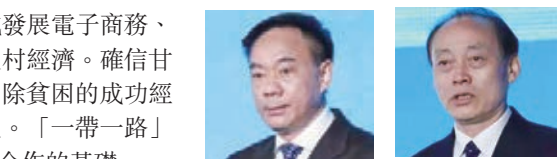
尼泊爾駐華大使馬亨德拉·潘迪