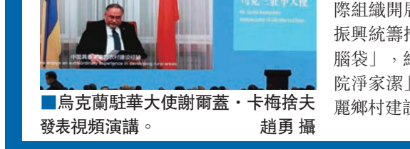
烏克蘭駐華大使謝爾蓋·卡梅捨夫發表視頻演講。