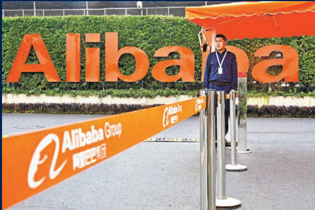
阿里巴巴在聖誕節前收到壞消息，被監管機構立案調查。資料圖片

一次螞蟻被四部門約談是在11月21日，當時正值螞蟻集團滬港兩地首次公開募股（IPO）至準備上市掛牌前的最後階段，但約談後第二日，上海證交所叫停螞蟻上市，螞蟻香港上市計劃亦一併暫緩。此次金融管理部門再次約談螞蟻集團，公告稱，人民銀行、銀保監會、證監會和外匯管理局將於近日約談螞蟻集團，督促指導螞蟻集團按照市場化、法治化原則，落實金融監管、公平競爭和保護消費者合法權益等要求，規範金融業務經營與發展。