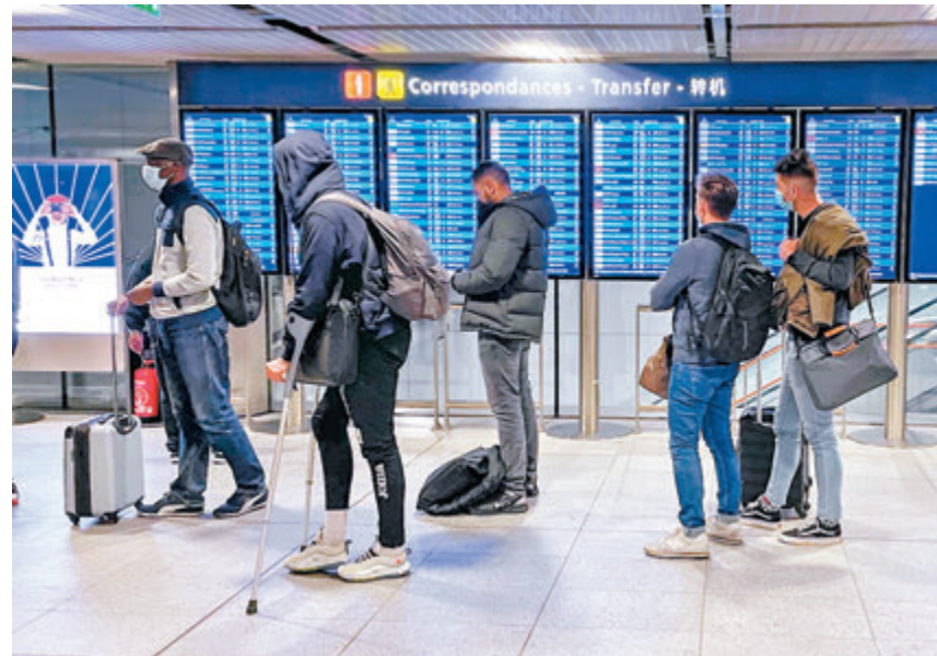
香港特區政府昨日深夜刊憲，收緊入境防疫規定，今天起所有於登機當天或之前21天曾逗留南非超過兩小時的人士，禁止登機前來香港。

香港文匯報訊（記者 文森）全球新冠肺炎疫情嚴峻，繼英國之後，南非發現另一種變種新冠病毒。香港特區政府昨日深夜刊憲，收緊入境防疫規定，今天起所有於登機當天或之前21天曾逗留南非超過兩小時的人士，禁止登機前來香港。其他海外抵港人士，不論經機場或陸路口岸入境，必須到指定檢疫酒店強制檢疫21天，「疫監期」較之前延長7天。