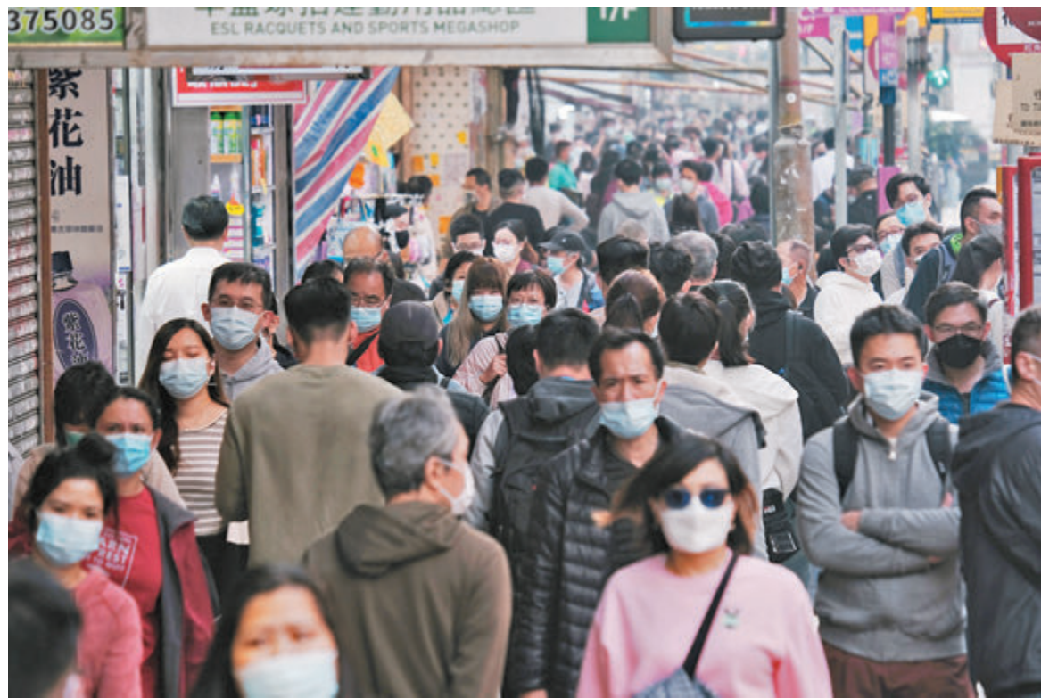
多宗確診個案與早前「做冬」家庭聚會有關，防護中心呼籲市民在長假期盡量避免集體活動。圖為旺角街頭人頭湧湧。

張竹君昨日在疫情記者會上表示，本港新增71宗確診個案，10宗為輸入個案，61宗屬本地感染，當中31宗源頭不明。另有約50宗初步確診。